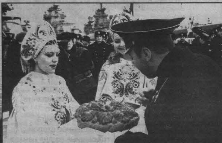
Хлеб-соль командиру БПК.

10 марта 1999 года, 10 часов 42 минуты. Борт большого противолодочного корабля «Адмирал Чабаненко» коснулся североморского причала. Последний боевой корабль, построенный корабельными Калининградского судостроительного завода «Янтарь» в XX веке, обрел свое постоянное место базирования.