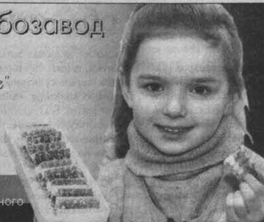
Подлежит обязательной сертификации.

Для производства каждого изделия используется натуральное сырьё отечественного производства, без консервантов.