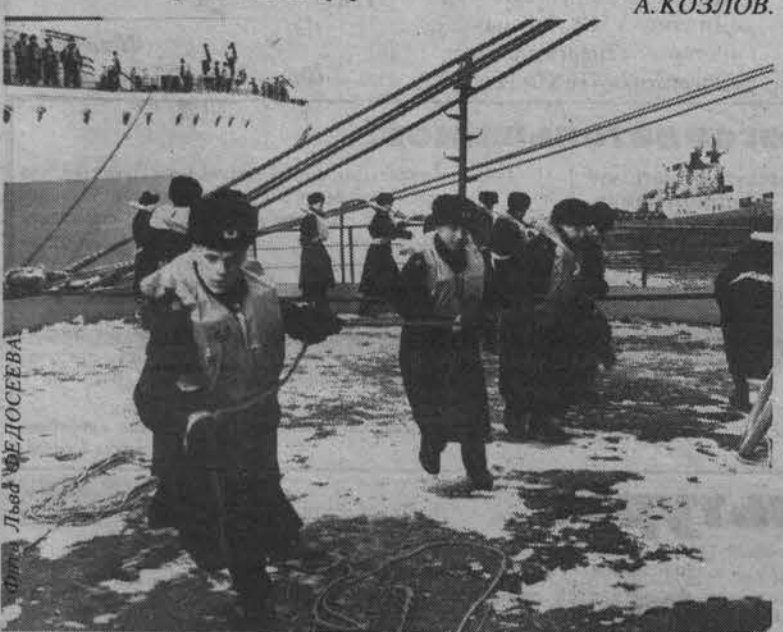
Эх, не легкая это работа - швартовка!