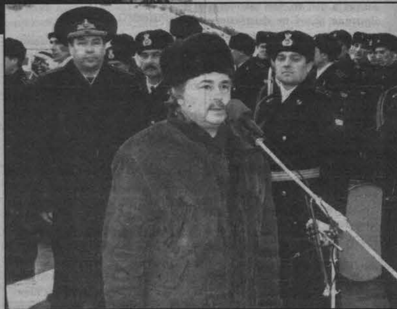
Виталий Волошин приветствует моряков нового корабля.

Северным флотом вице-адмирал Вячеслав Попов вручил командиру корабля капитану 1 ранга Михаилу Кольвушко картину.