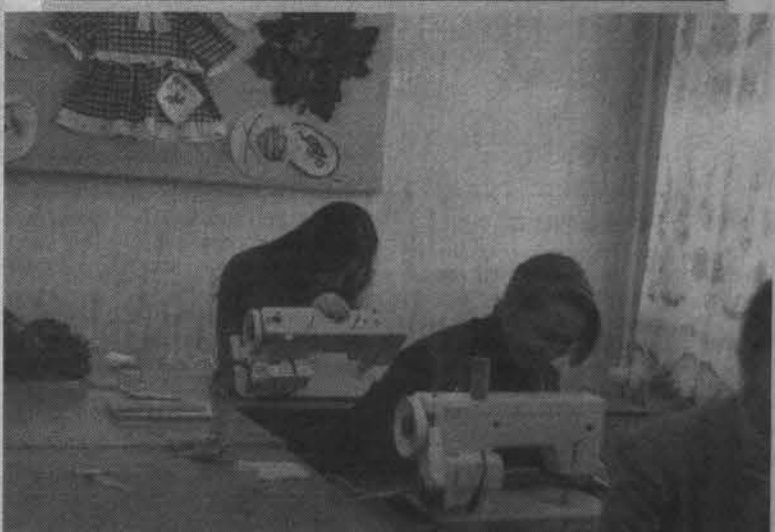
Они учатся профессиям.

но покупать на рынке - свяжем сами. И в будущей семейной жизни им пригодится умение вязать, быть экономными хозяйками.