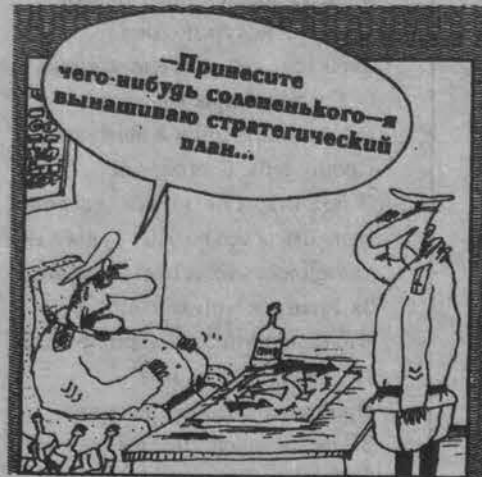
Рисунок Вячеслава ШИЛОВА.

Дежурный по кораблю лейтенант Капустин, едва не опоздав в назначенное расписанием время