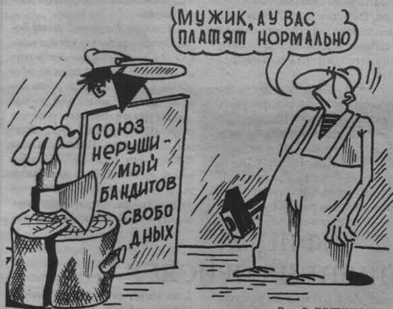
Рис. В. ЕВТУШЕНКО.