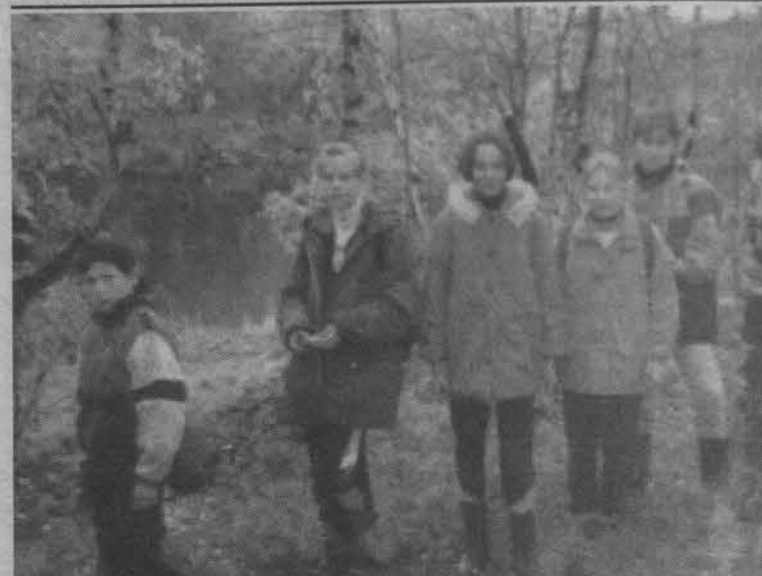
Юные экологи клуба.

Участвуют в нем команды с 5-го по 11-й классы. Ребята готовятся к нему заранее, сочиняют песни, придумывают эмблемы, совершенствуются в технических навыках.