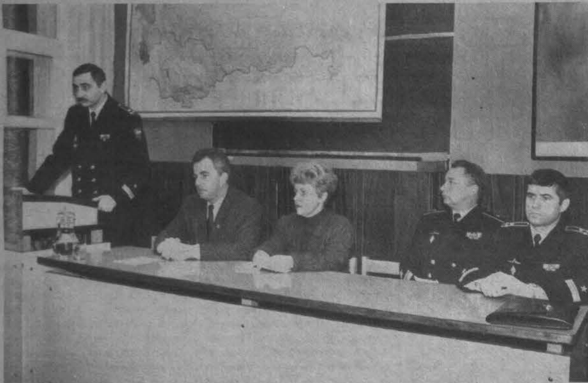
Традиционная встреча с избирателями.