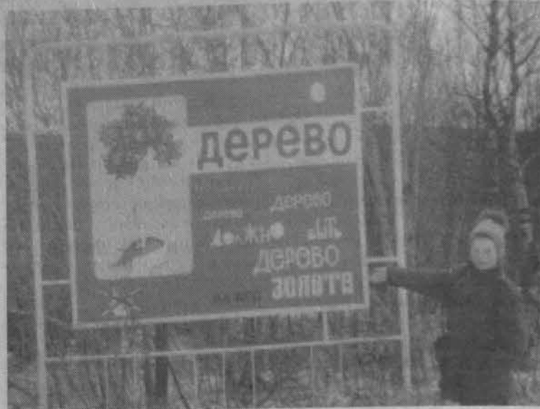
Деревья должны жить!

Ежегодно в школе проходит традиционный туристский слет.