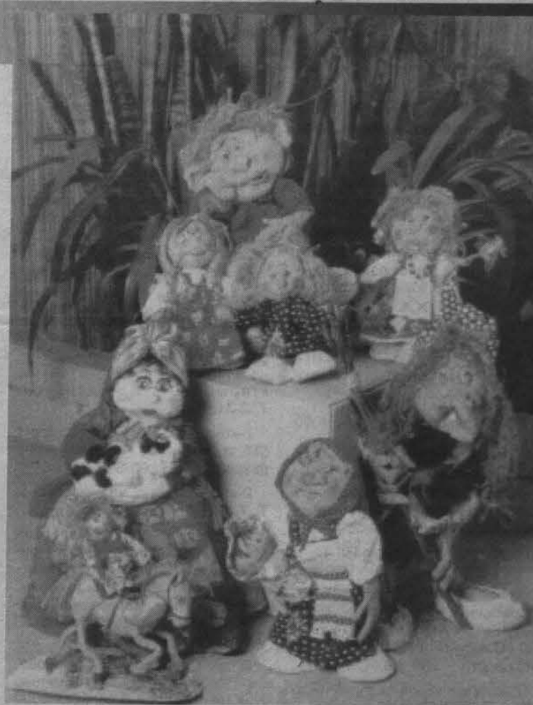
Не мешать! Домовенок Кузя думает.