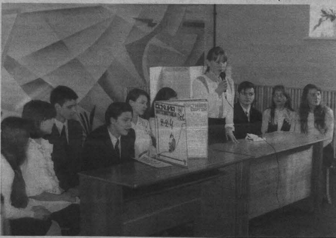
Работа группы управления игры «Новая цивилизация».