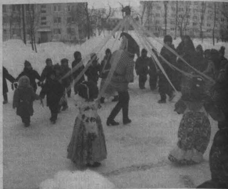
Праздник во дворе детского сада.