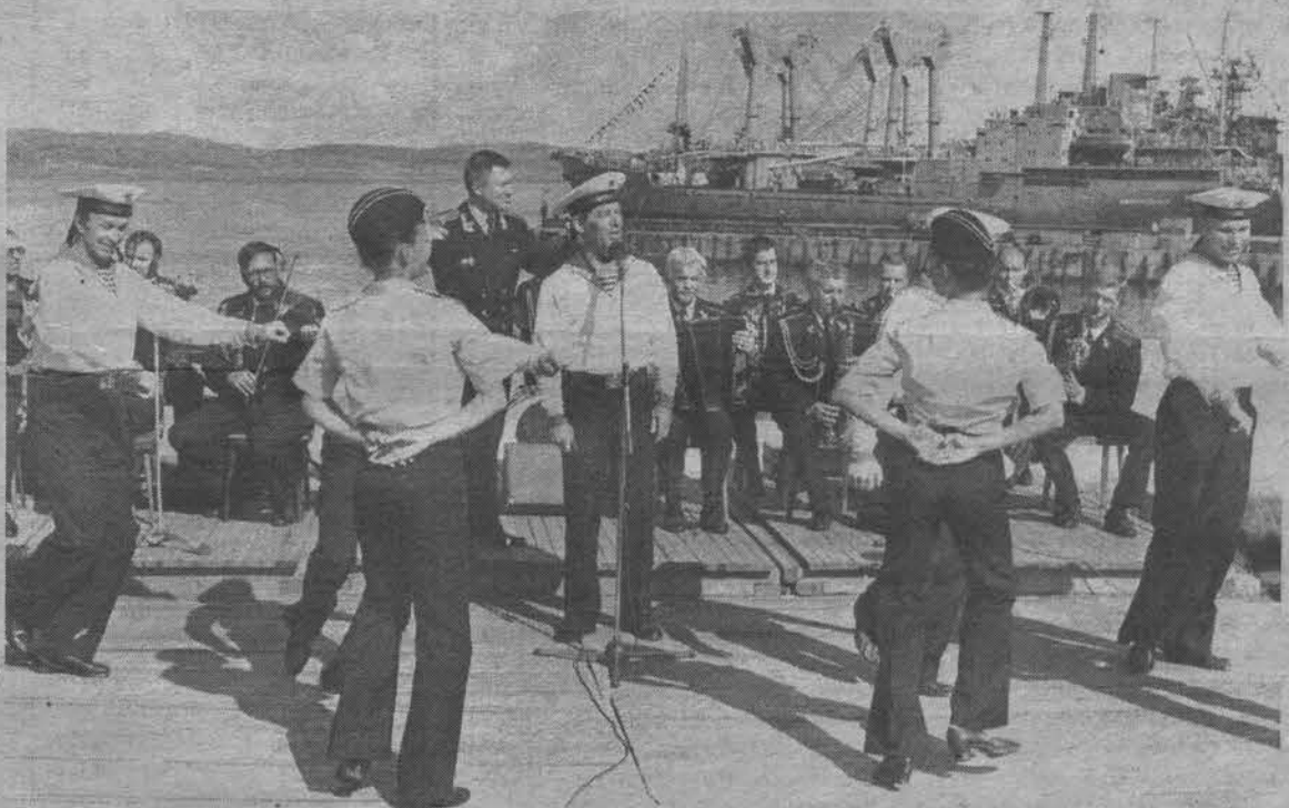
1999 год. День Военно-Морского Флота.

В городе Владимире 16 декабря этого года преждевременно скоропостижно скончалась