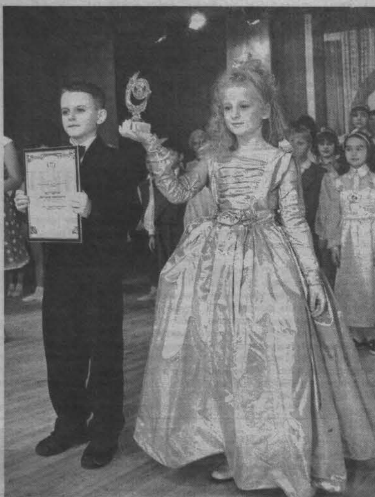
В детской ладони - знак благодарности.

15 декабря, в день второго рождения Дома творчества, ребят и