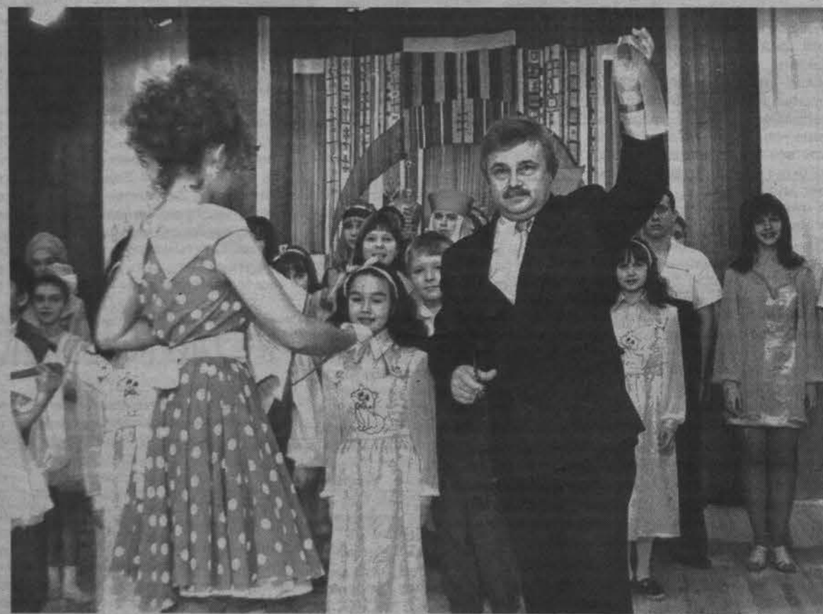
Без красной ленточки не обходится ни одно открытие. Традиция есть традиция.

Приглашаем всех ребят и родителей НА ЗАЖЖЕНИЕ ГЛАВНОЙ ЁЛКИ Североморска. Начало праздника 23 декабря в 14.00.