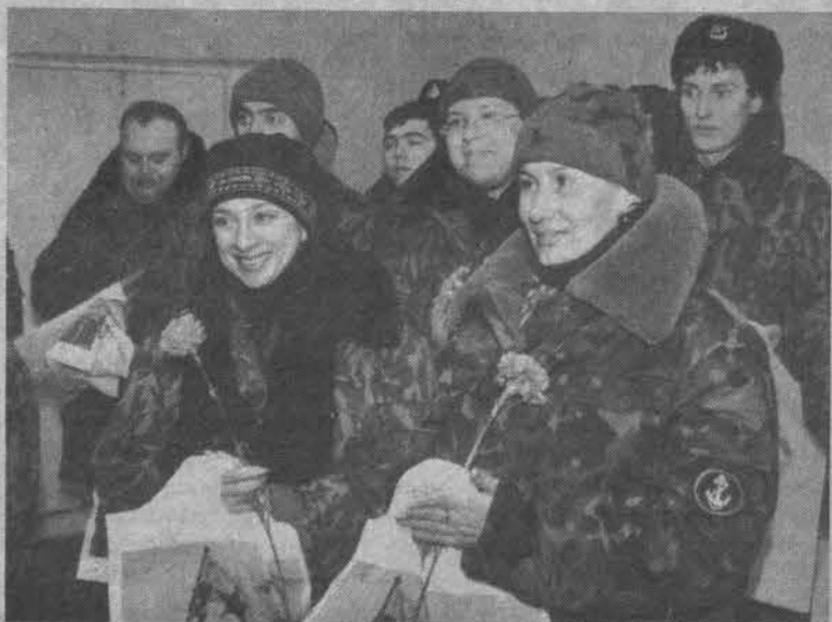
После творческой командировки в Чечню.

Коллектив ансамбля по праву считается одним из лучших профессиональных коллективов в Военно-Морском Флоте России. Он неоднократно занимал призовые места на смотрах-конкурсах. В 1981 году ему была присуждена премия Ленинского комсомола.