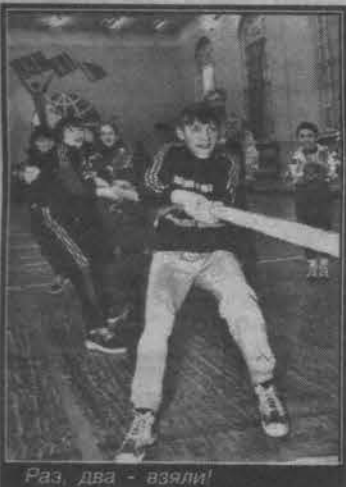
Раз, два - взяли!

В Мурманск съехались команды из всех городов Кольского