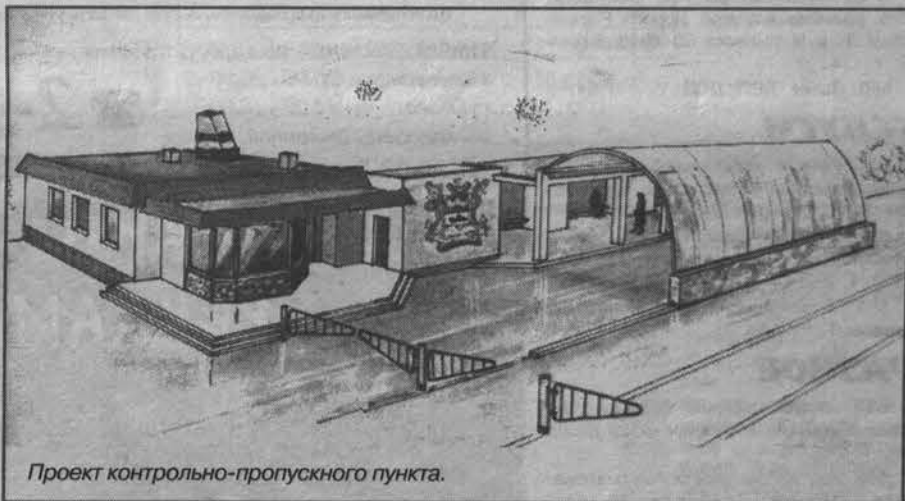
Проект контрольно-пропускного пункта.