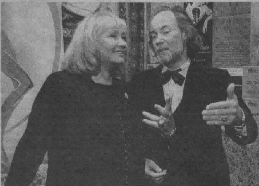
Народные артисты России Лариса Лужина и Владимир Конкин в Мурманске.

- Раньше, конечно, было больше возможностей, была возрастная перспектива, а сейчас мне уже шестой десяток... Нет, я не кокетничаю, я еще могу, если меня к теплой печке прислонить. (Смеется).