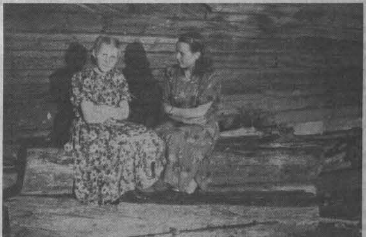
Галя (слева) с подружкой.

Виктория НЕКРАСОВА.