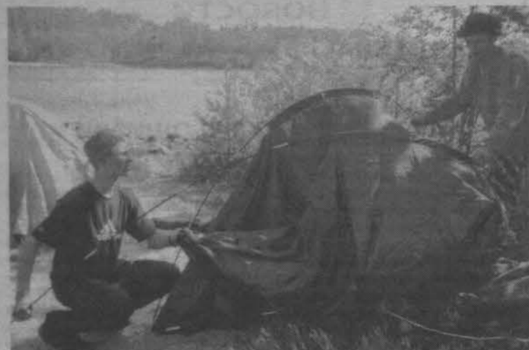
Строим палаточный город.