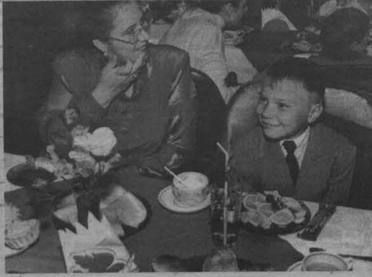
Благотворительный праздник для первоклассников в ресторане «Чайка».