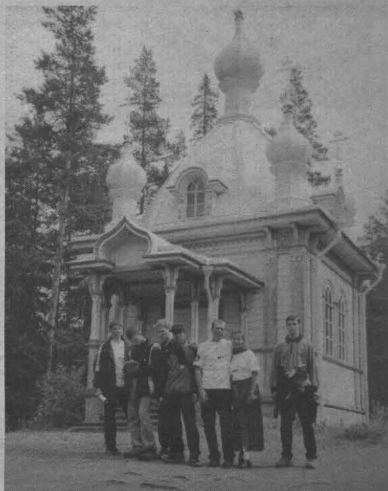
Часовня на острове Валаам.