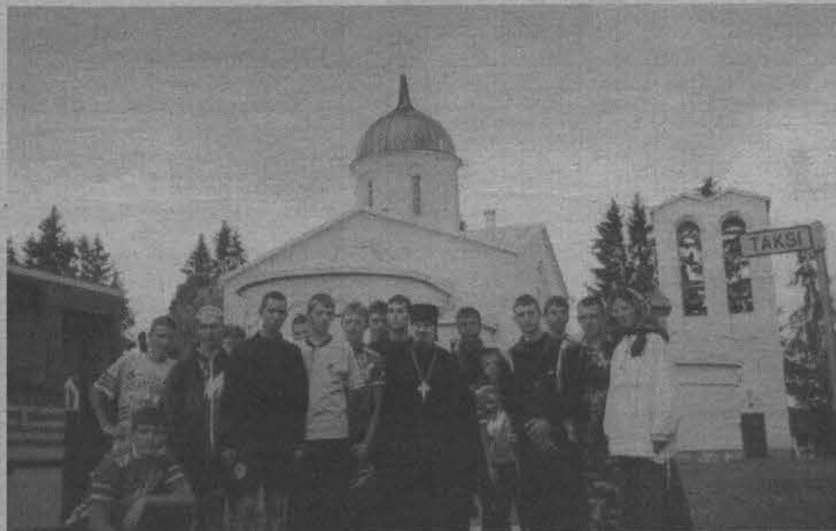
Нововалаамский монастырь в Финляндии.

считает, что основной целью любого проекта должно быть обязательное участие в нем детей, и не только наших североморских, но