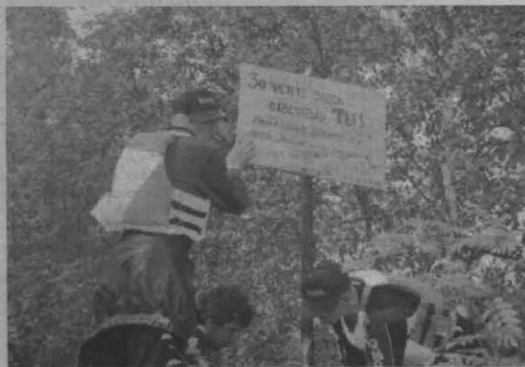
Наведем порядок на планете!