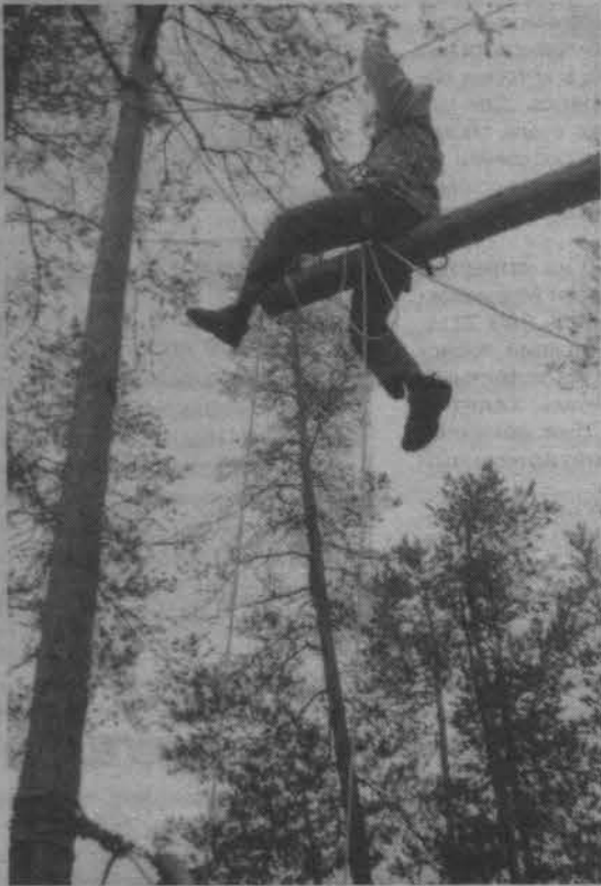
Карельские сосны как учебное пособие по скалолазанию.

Отряд смельчаков из росляковской школы № 3, единственный от Мурманской области, принял этим летом участие в необычном приключении. В экологическом карельском лагере «Большое приключение с «Кодак» ребята провели семнадцать интереснейших дней. Организатор и вдохновитель экспедиции - знаменитый путешественник и исследователь Дмитрий Шпаро. Огромную поддержку движению оказывает фотоимперия «Кодак».