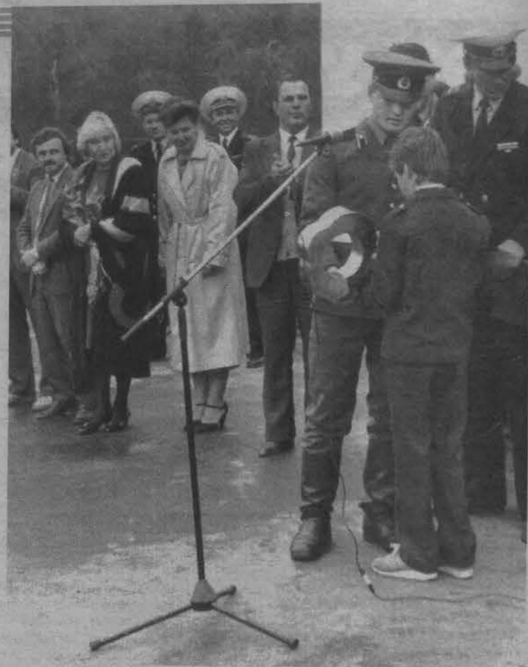
Передача символического школьного ключа. (Сентябрь 1990г.)

А еще эта школа особая потому, что она едва ли не единственный в поселке островок, где теплится жизнь. Без преувеличения. Куда податься после занятий? Нет здесь ни клуба, ни дискотеки. Поэтому школа открыта чуть ли не круглосуточно. В 15 часов начинают работу кружки: «Ларец сказок», «Занимательная математика», «Бумажная страна», вокальный, мягкой игрушки, краеведения, работы с бросовым матери-