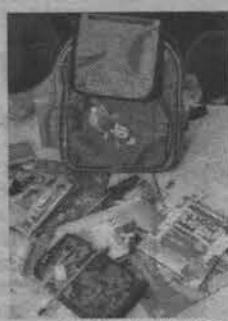
Подарок от мэра.

Впервые начало учебного года отмечается в нашем городе так широко. Для восьмидесяти первоклашек из малообеспеченных и многодетных семей был организован веселый праздник в ресторане «Чайка». Пригласили новопришедших школьников из поселков Росляково, Сафоново, Североморска-3, Щукозеро, и, конечно, Североморска. Торжество немно-