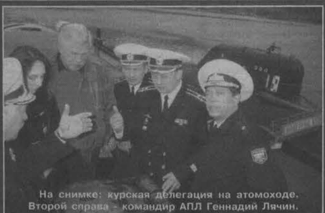
На снимке: курская делегация на атомоходе. Второй справа - командир АПЛ Геннадий Лячин.

В 1994 году Курская область взяла шефство над атомным подводным крейсером, которому было присвоено наименование «Курск». 10 июля 1999 в поселок Видяево приехала делегация из Курской области, которую возглавил Губернатор Александр Руцкой. А через месяц АПЛ «Курск» под командованием капитана 1 ранга Геннадия Лячина ушла на боевую службу, которую экипаж выполнил с оценкой «отлично».