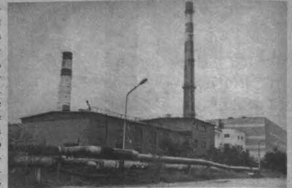
Надежды на благополучную зиму росляковцы связывают с ТЭЦ.

- Средняя школа № 4 уже практически закончила ремонт,