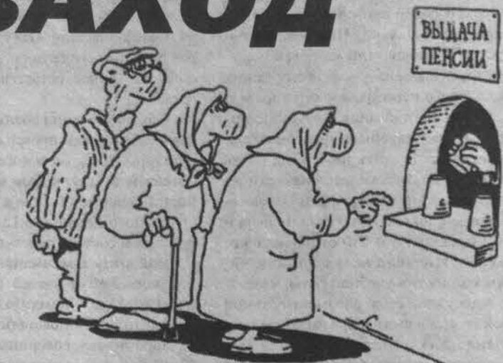
Рис. Игоря Куйско.

После жесточайших уроков прошлых лет население отдает