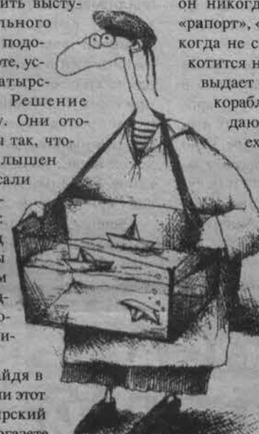
Рис. С. Аруханова.