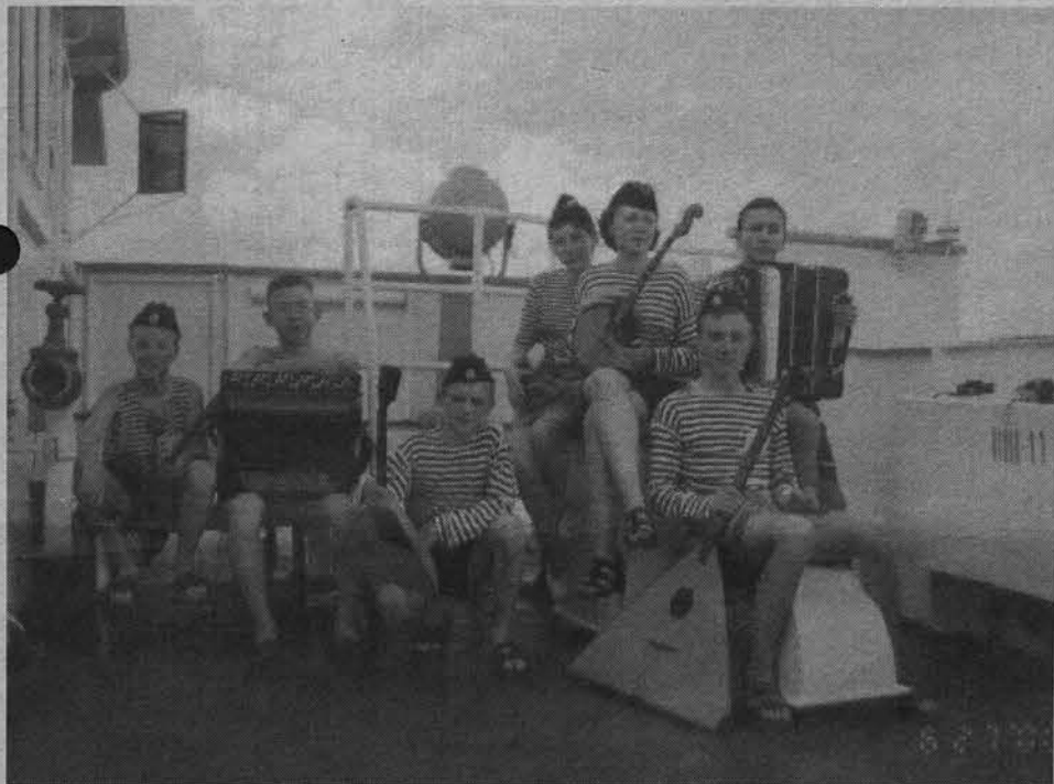
Североморский «Сувенир» на теплоходе.