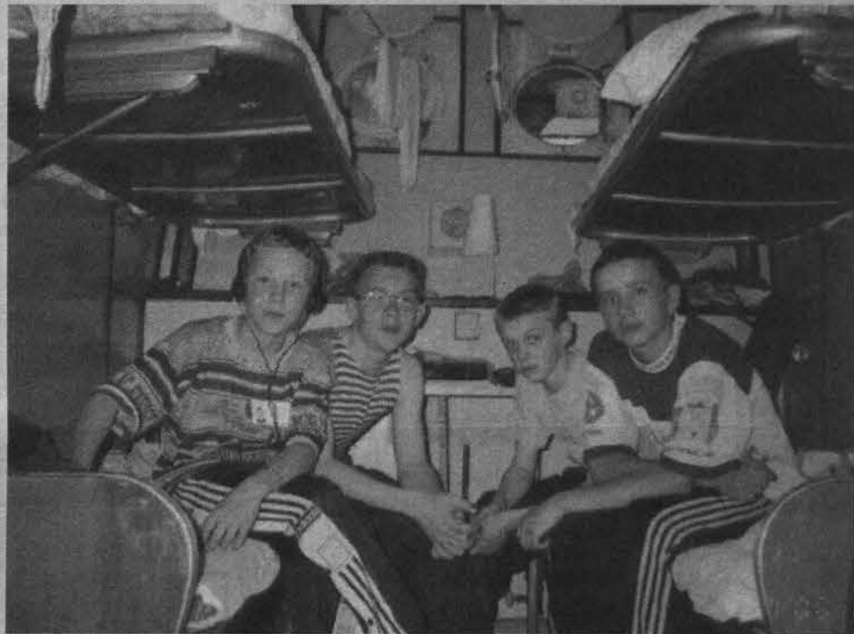
В каюте друзьям не тесно.