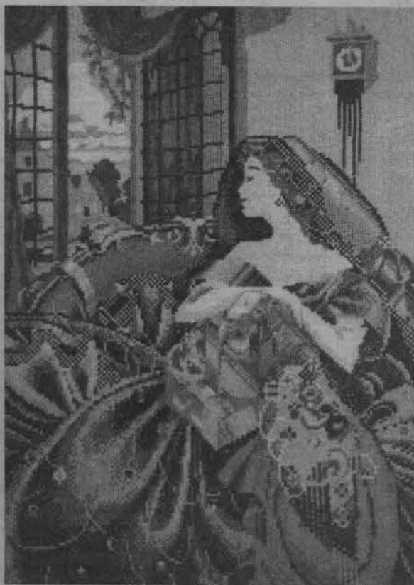
Работа С.Арсентьевой «Дама у окна».