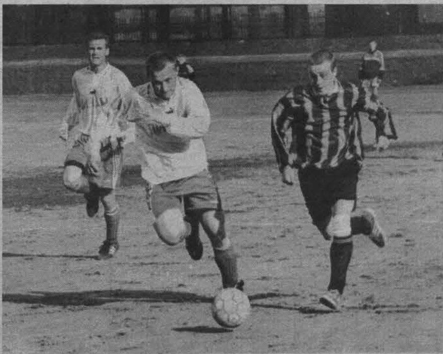
Редкая пробежка к воротам мурманчан.

Но мурманские милиционеры несмотря ни на что продолжали играть. Они были намного быстрее и техничнее представителей флота. Стремительно проходили середину поля длинным точным пасом, при любой возможности били по воротам, дорожили мячом и до последнего боролись за него, а потеряв, тут же спешили на защиту своих ворот. И прекрасное комбинационное взаимо-