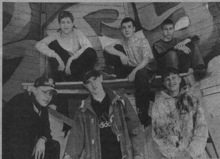
Ребята из клуба брейк-данса «Да-ГАС».