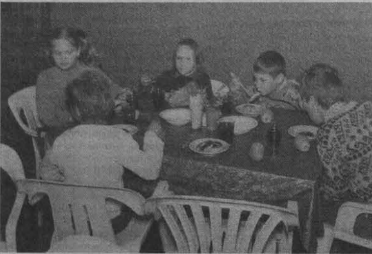
Завтрак в ресторане «Океан».

Кроме того, до сих пор на их базе работает социальная столовая. Пять дней в неделю 80 пожилых людей малообеспеченной категории получают обеды, на которые Красный Крест выделяет 15 рублей на 1 человека в день. На эту сумму надо приготовить комплекс блюд. Удастся это благодаря тому, что руководство завода пошло навстречу и разрешило применять так называемые плавающие наценки на продукты. Так что до августа, пока Красный Крест сможет перечислять деньги, социальные обеды здесь будут готовиться.