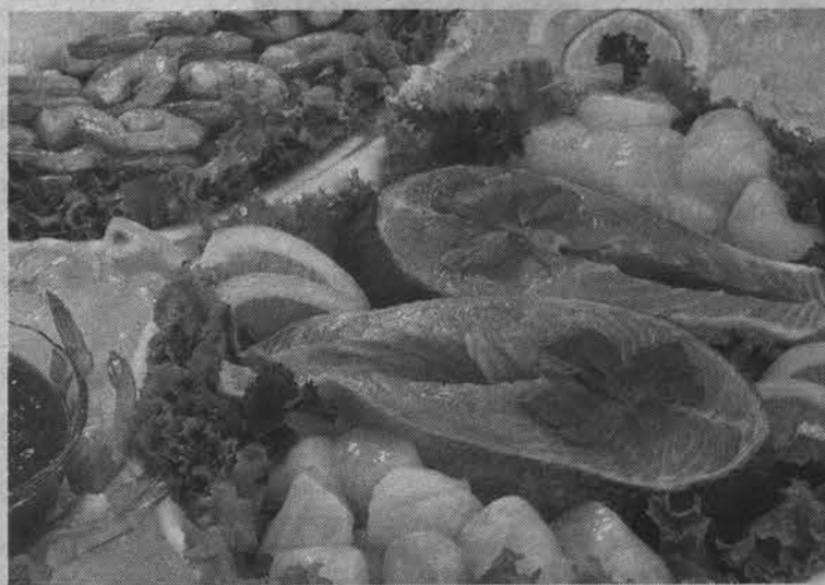
Продукты бывают вкусные, если они не протухшие.