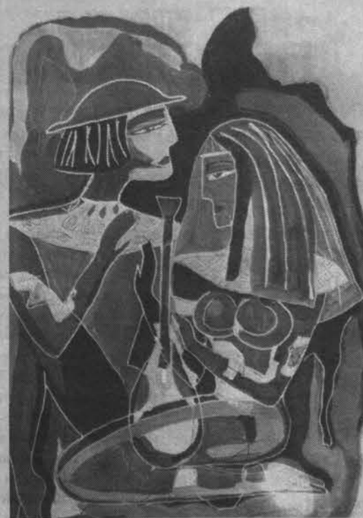
«Поэт и муза».

В том, что это действительно так, я убедилась на встрече в библиотеке, которая называлась «Творческий портрет читателя». Там о Жене говорили другие. Поэзия и изобразительное искусство мирно уживаются