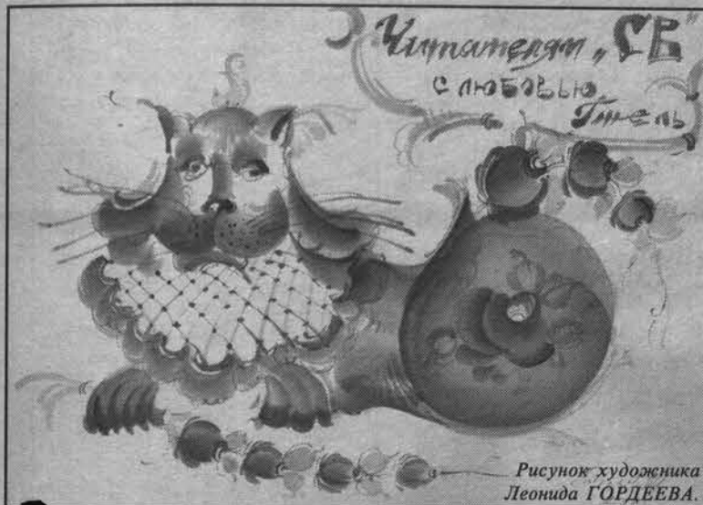
Рисунок художника Леониды ГОРДЕВА.