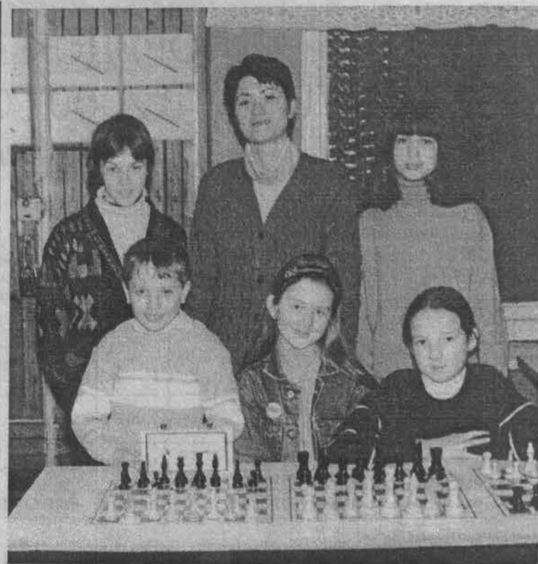
Команда гимназии № 1.