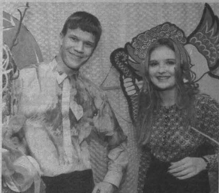
Участники молодежного шоу.

Проявляли активность и зрители. Они сыграли роли в сказке-истории про любовь Валентина к Валентине со счастливым концом. Порадовал своим выступлением сам Майкл Джексон в женском исполнении, а также «короли» местного брейк-данса. Демонстрировали свое искусство юные театралы. Разносили любовные послания «амурчики», порхавшие между рядами.