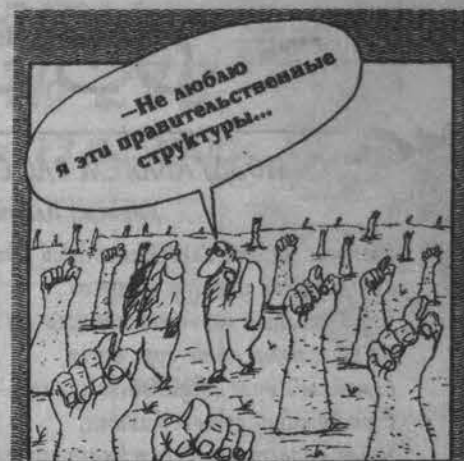
Рисунок Вячеслава ШЕЛОВА

Статьи 352 и 353 проекта трудового кодекса предусматривают его приоритет-