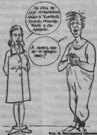
Рис. И. Мазурова (Москва)