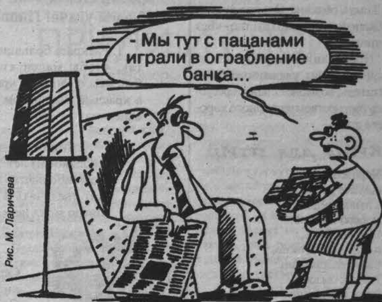
Рис. М. Ларичева

рование пребывания таких подростков в спецшколах.