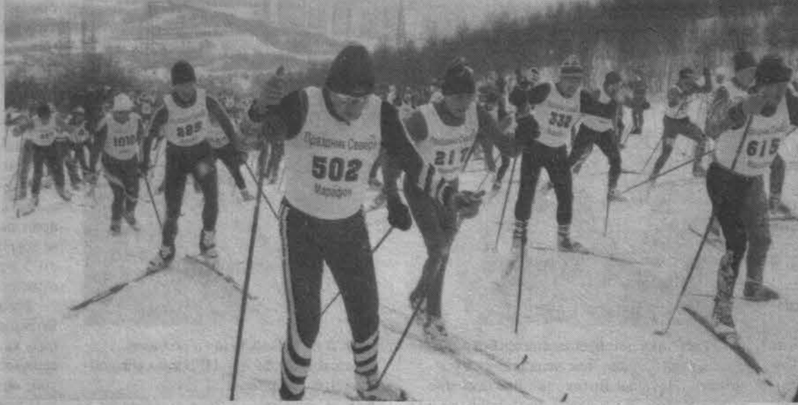
Долина Уюта. Марафон на празднике Севера в 1999 году.

- Приходится постоянно «ломать» себя: заставлять, подгонять, настраивать на тренировки, тем более на гонки. Пройдешь километров тридцать-сорок, в глазах чертики забегают - точеч-