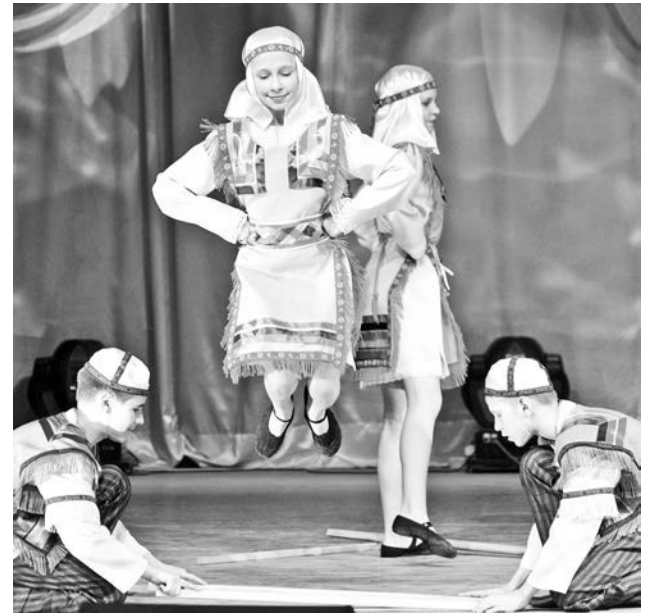
Мало разучить движения – нужно вжиться в образ. В «Каблучке» каждый – артист.