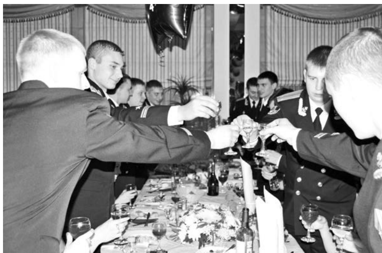
За тех, кто в море – стоя!