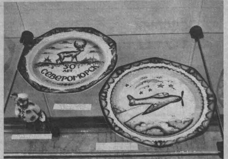
Работы гжельских юных мастеров.