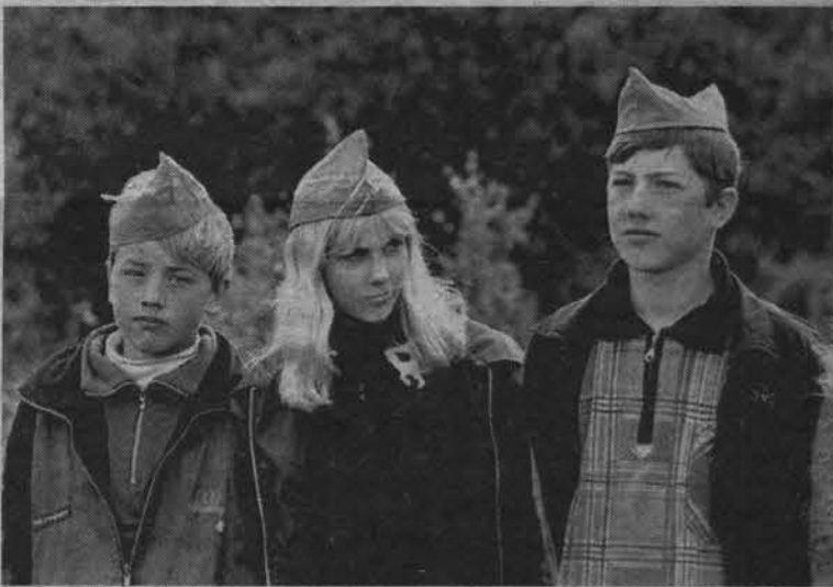
Юные участники «Вахты памяти-2001».

Виктория НЕКРАСОВА.