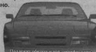
Подлежит обязательной сертификации.