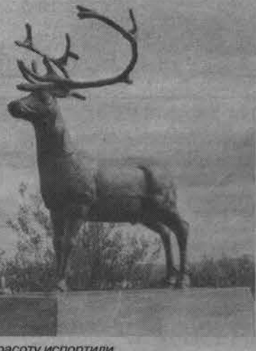
Такую красоту испортили...

За предоставление достоверной информации гарантируется вознаграждение.