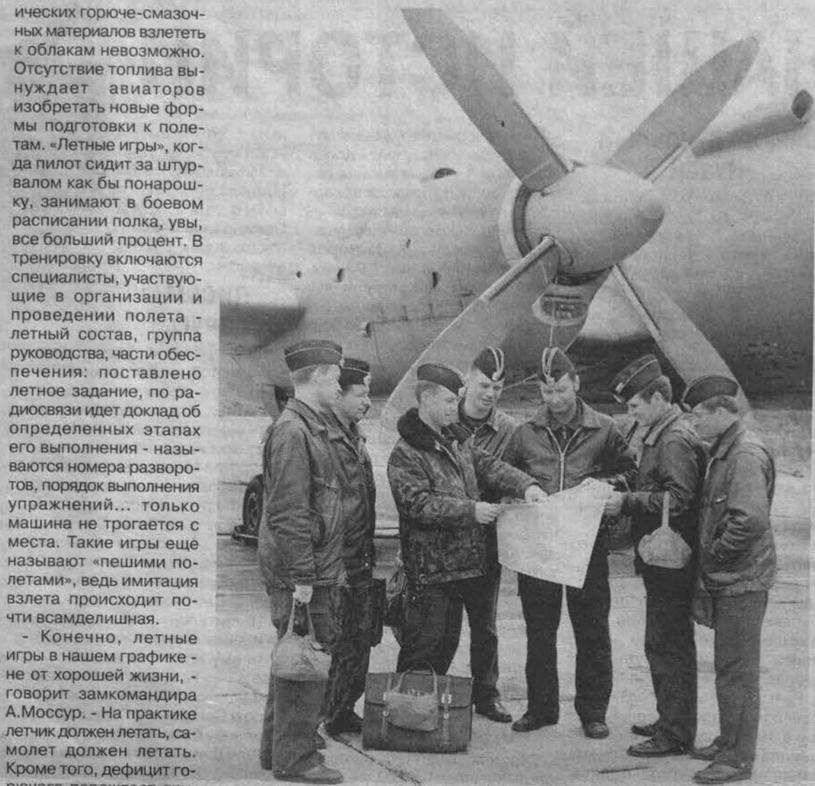
Уточнение задачи перед вылетом.

Между тем подготовка пилотов к столь разнообразной деятельности в небе зачастую происходит... на земле. Без проза-