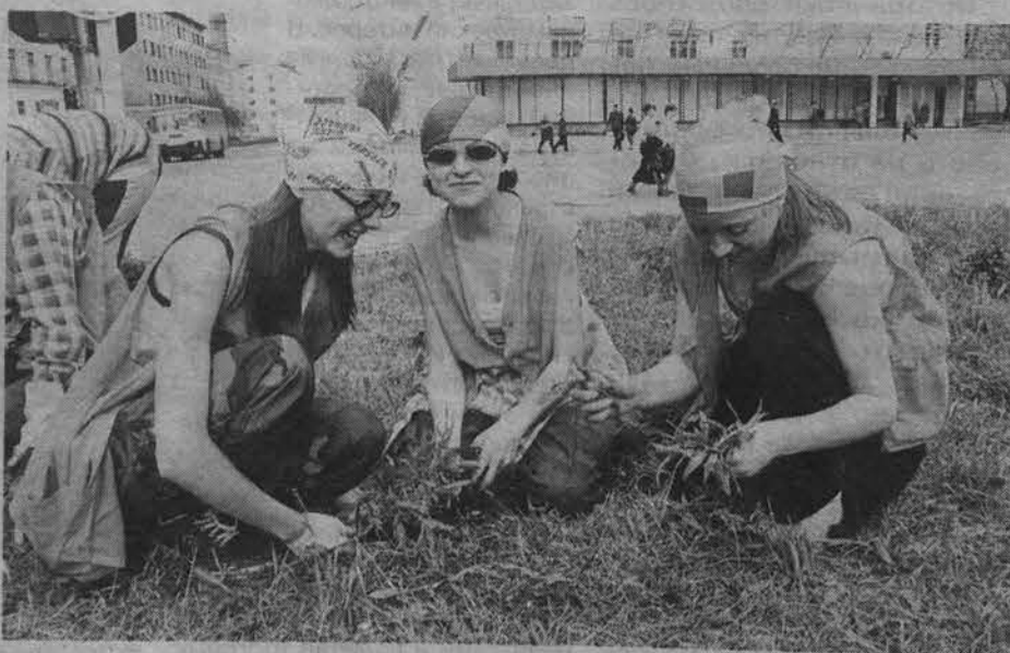
Ох, и тяжело вырывать сорняки!

клумбе появились две ямы приличных размеров. После жители близлежащих домов нам рассказали, что видели, как двое набирали землю в ведра прямо с клумбы.