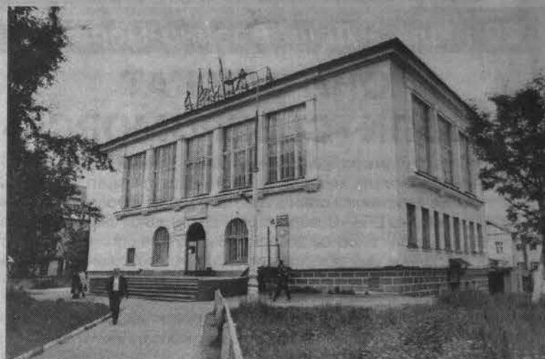
«Чайка» всегда рада гостям.