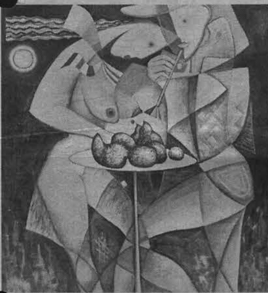
Л.Орлов «Вечерние мелодии».