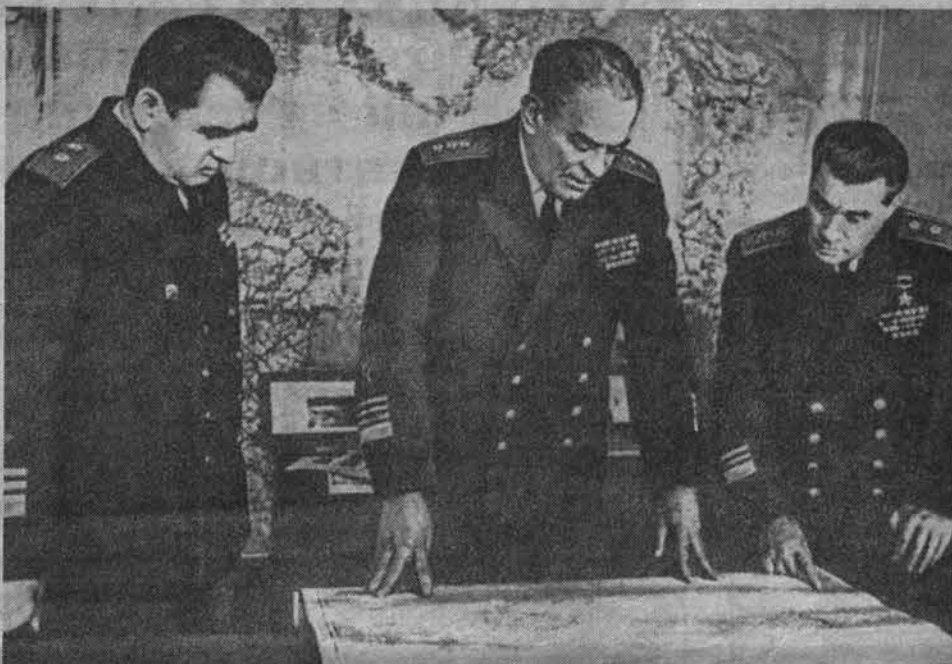
Командующий Северным флотом адмирал С.Лобов, член военного совета - начальник политуправления флота вице-адмирал Ф.Сизов (слева) и первый заместитель командующего флотом вице-адмирал А.Петелин у карты действий сил флота на маневрах «Океан». 1970 г.

Около 7 часов утра вновь всплыли в позиционное положение и произвели замеры высот Солнца, когда дневное светило было по азимуту около 90 градусов. Получили долготу места. Дальнейшие действия по определению места и поправки системы курсоуказания произво-