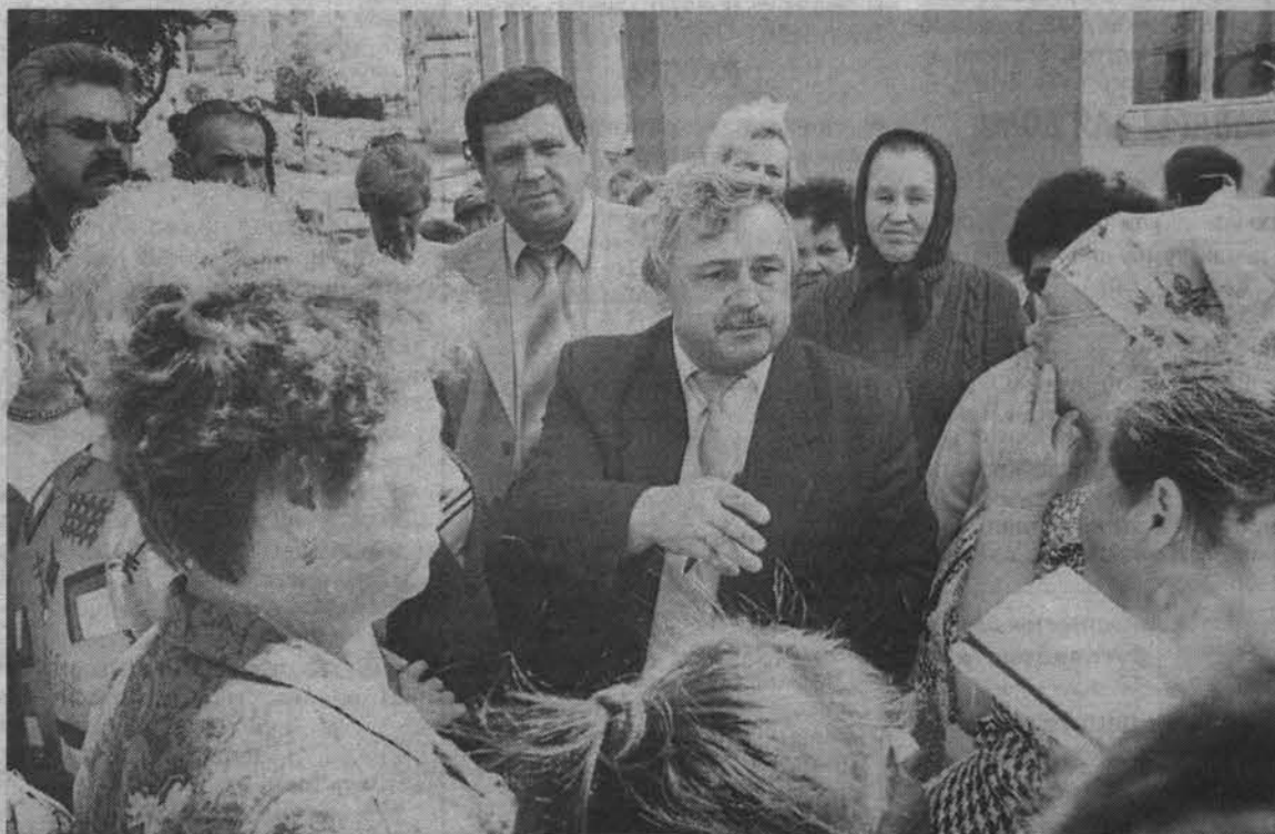
На улице Комсомольской мэра Виталия Волошина жители обступили плотным кольцом и, перебивая друг друга, торопились высказать свои проблемы.

плане контроля за ходом подготовки города к зиме, а также хорошая возможность посмотреть на месте и решить, на что следует обратить внимание сейчас, а что необходимо внести в план будущего года.