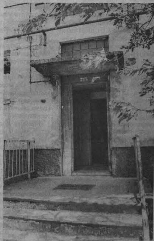
В доме 26 на ул. Комсомольской жители одного из подъездов почти год живут без входной двери.