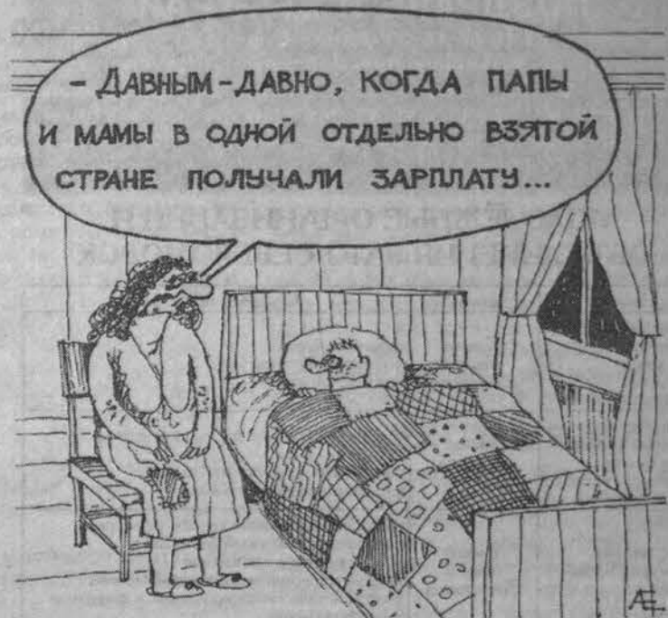
Рис. Алексея ЕВТУШЕНКО.

Могут возразить, вот государство что-то делает, есть программы бесплатной выдачи жилья малоимущим и т.д. Полноте... На всех не хватит. По данным Министерства экономики РФ, в марте 2001 года численность населения страны, живущего ниже прожиточного минимума, составила уже 54,4 млн. человек («Российская газета» от 11.05.2001г.). Причем обратите