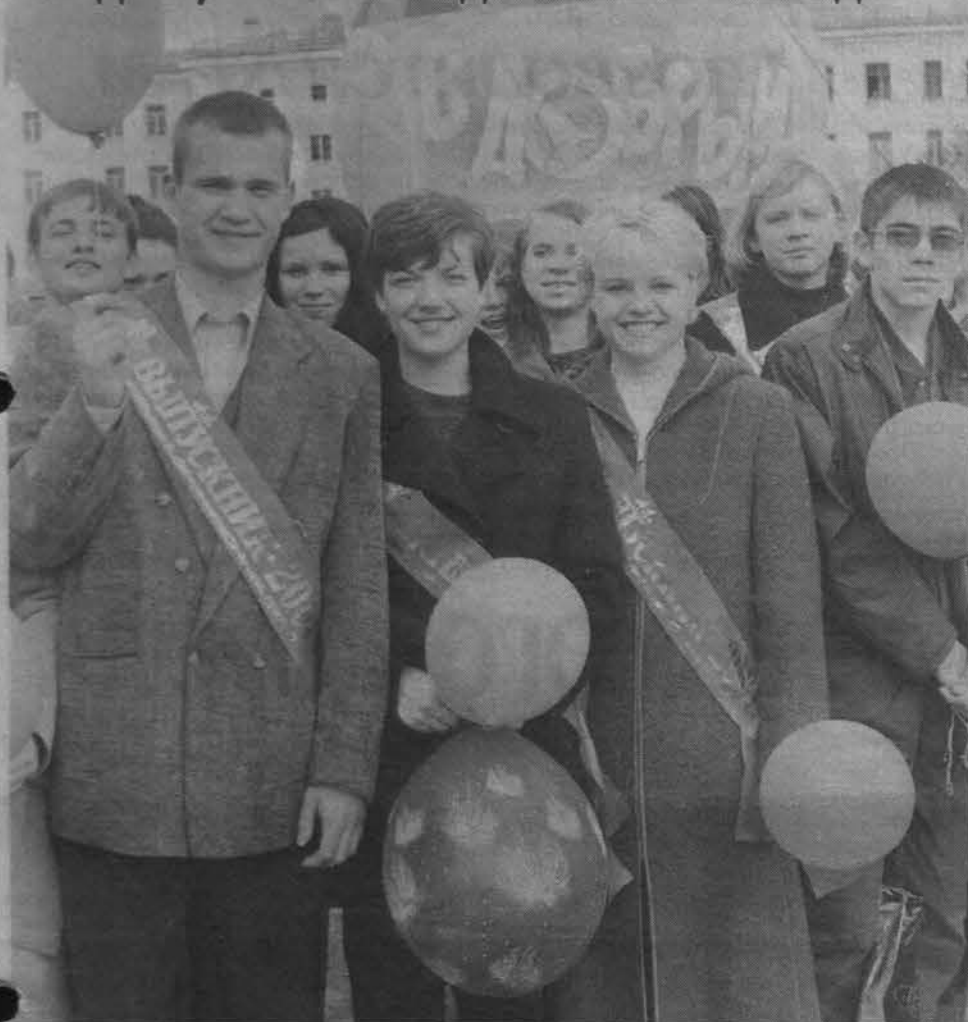
17 июня на центральном стадионе Северного флота прошел традиционный общегородской праздник «Выпускник-2001». Материал об этом читайте на 10 стр.