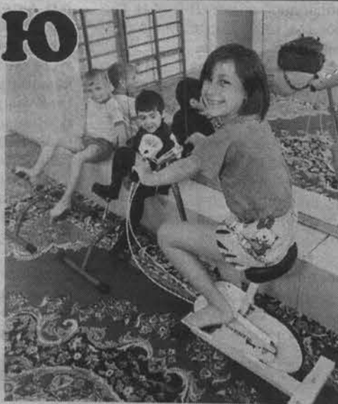
Вперед, к здоровью!