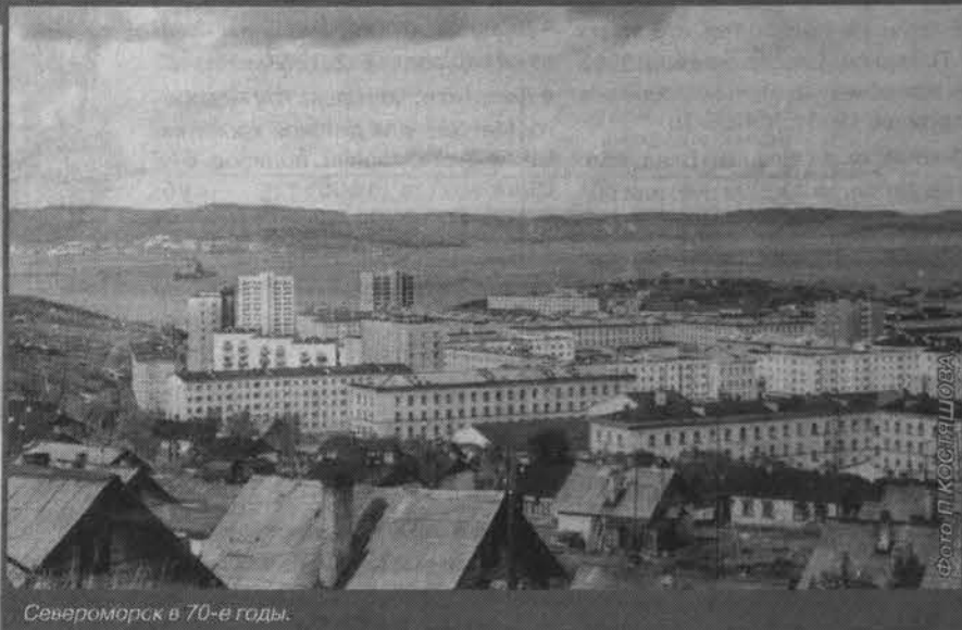
Североморск в 70-е годы.