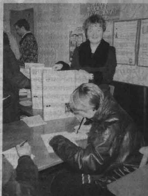
Выставка образовательных услуг.