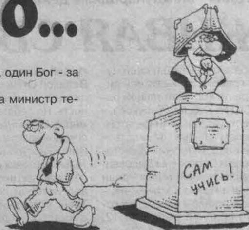
Рис. Игоря КИЙКО.