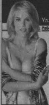
График работы: 11.00-20.00, без выходных