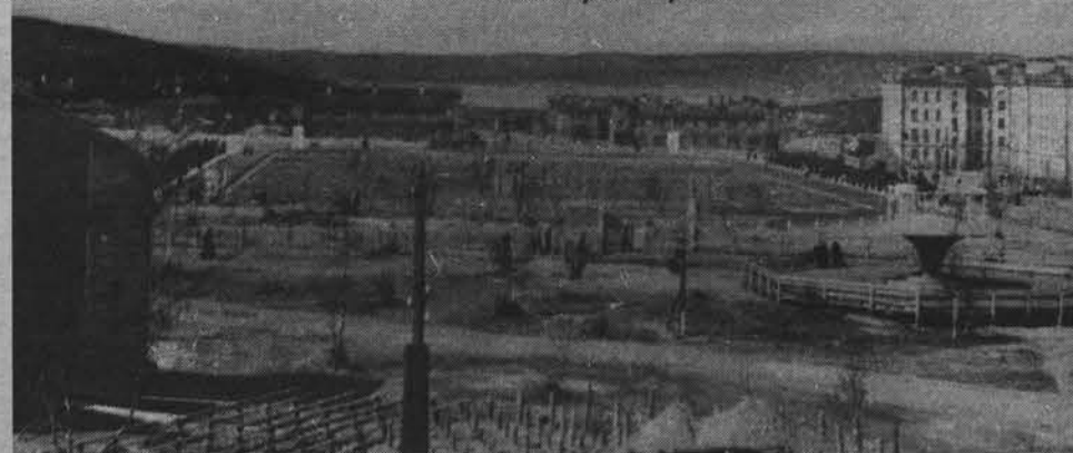
1951 год. Вид на городской стадион со стороны ул. Кирова. Круглое сооружение справа - танцплощадка. Теперь на ее месте СШ № 10.

На 1 января 1953 года жилой фонд города Североморска составлял 56600 кв.м. Каменных домов в нем было только 27,9%. На 1 января 1958 года жилой фонд вырос в 2,6 раза, достигнув 144000 кв.м, причем жилой фонд в каменных домах вырос в 4 раза.