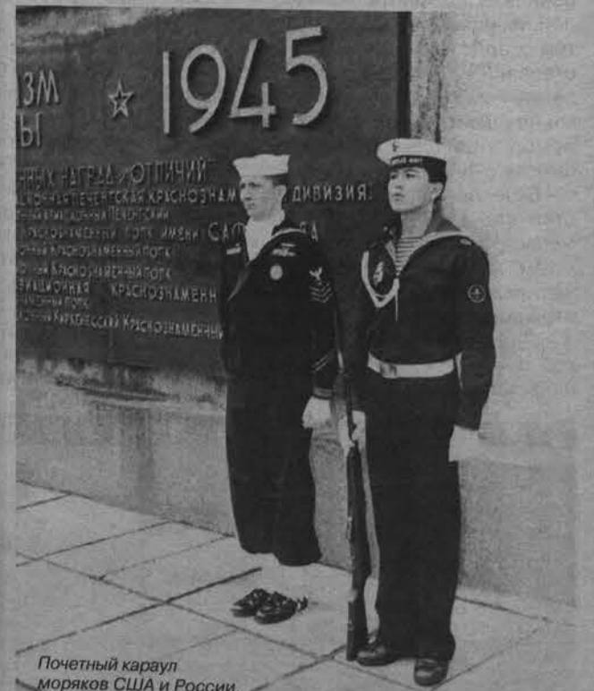
Почетный караул моряков США и России.