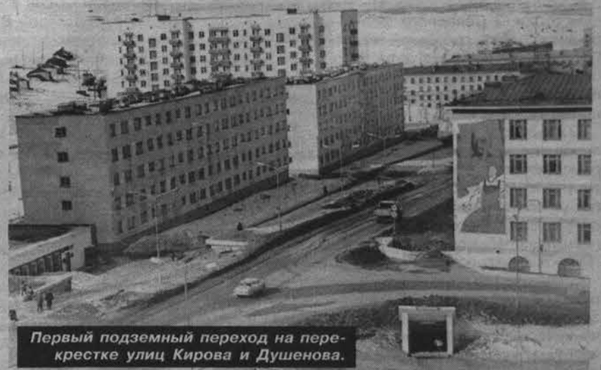
Первый подземный переход на перекрестке улиц Кирова и Душенова.