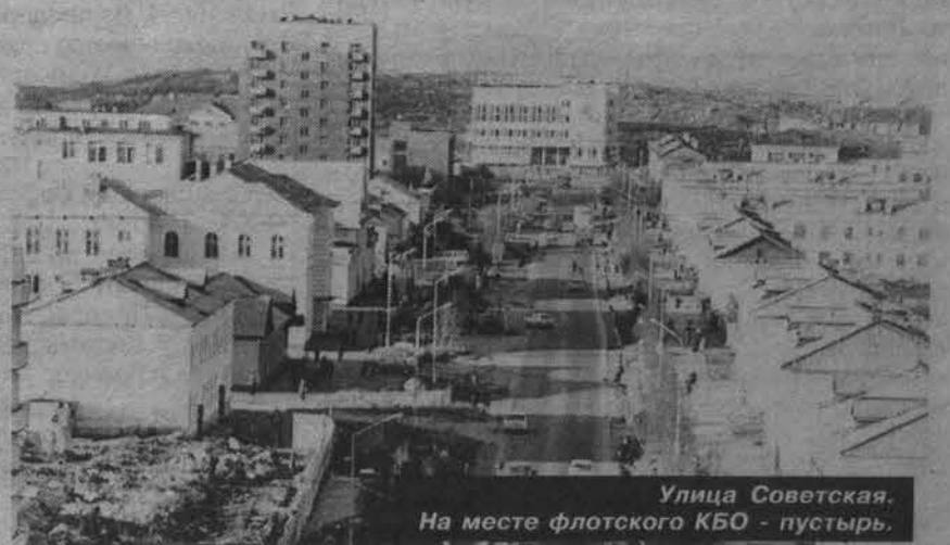
Улица Советская. На месте флотского КБО - пустырь.