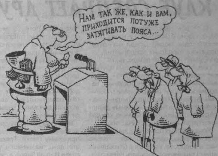
Рис. Игоря Кишко.

Начнем с маленьких региональных статистических чудес. Госкомстат РФ 1 августа 2000 года опубликовал в «Российской газете» основные показатели социально-экономического положения в Российской Федерации за первое полугодие 2000 года. Согласно этим данным стоимость минимального набора продуктов питания в июне 2000 года соста-