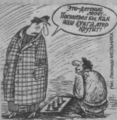
Рис. Леонида Мельника

Обсуждая тему коммунальной реформы, СМИ как заклинание повторяют преимущественно два показателя: полная оплата услуг за счет населения, эти расходы в 2001 году могут составлять не более 22% дохода семьи, да и