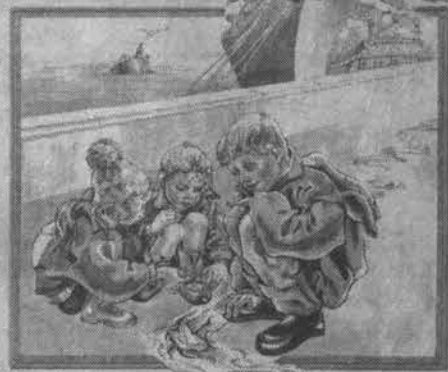
Ирина Ядринцева Рисование Светланы Абарина