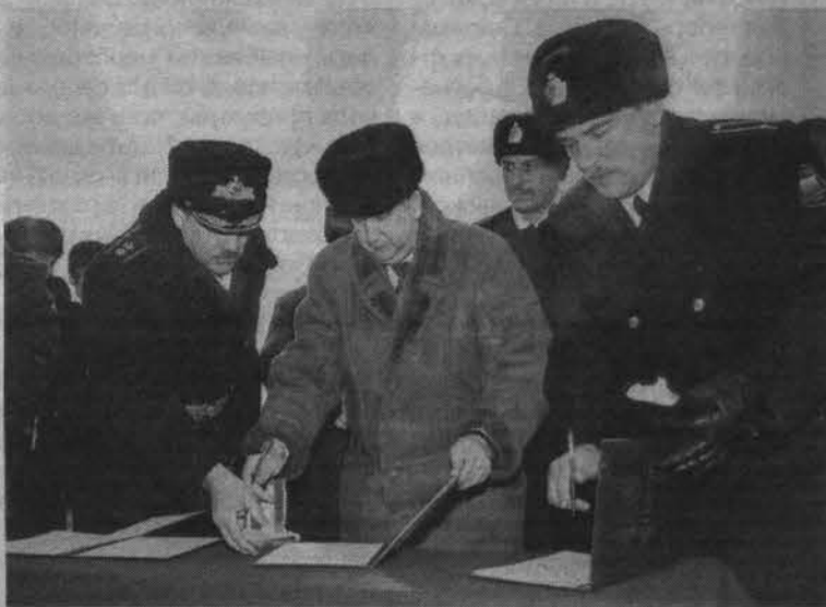
Подписание договора об установлении шефских связей.