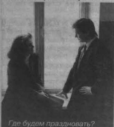
Где будем праздновать?