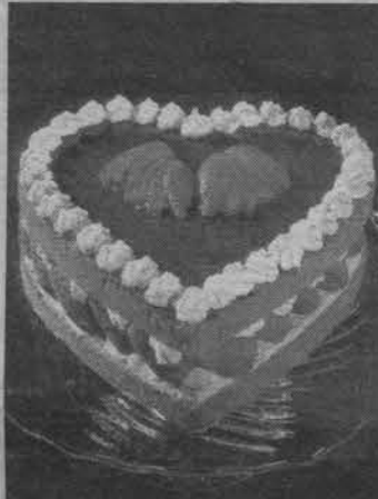
Подлежит обязательной сертификации.

состоит из четырех слоев медового полуфабриката домашнего, прослоенных кремом "Вишней" с фруктами из компота "Персик". Поверхность покрыта этим же кремом и украшена рисунком.