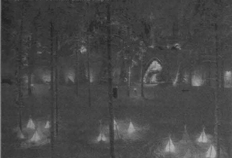
Дорога в мир приключений: перед входом в сказочный Санта-парк