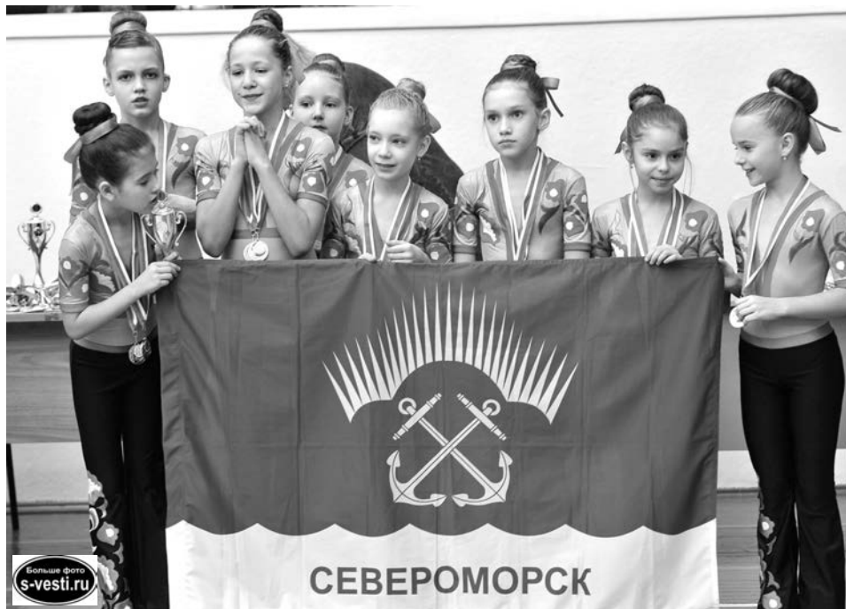
Команда «Акварель» в категории до 10 лет стала первой в «Степ-аэробике» и второй в «Аэробике».

Городское первенство стало разминкой перед кубком страны по фитнес-