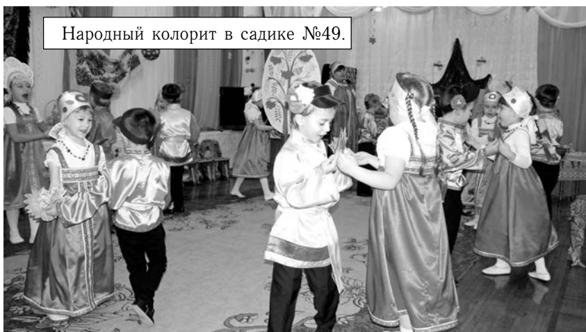
Народный колорит в садике №49.