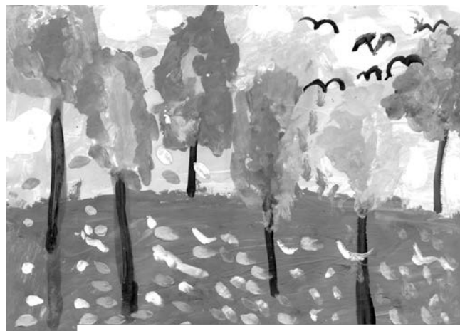
Вероника Орлова, 6 лет.