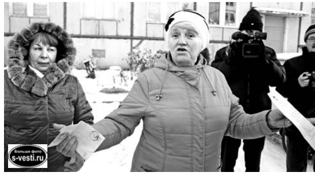
По документам на ул.Агеева, 7, уже все хорошо, а на деле...

Для этой цели уже имеются какие-то заготовки, например, опоры. Среди прочих обсуждался вариант с временным освеще-