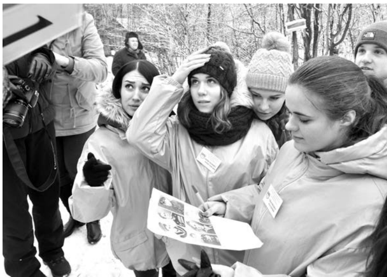
У конкурсантов больше времени ушло на теоретические задания.

Участников экзаменовали на знание основ истории родного края и военного дела, символики и техники времен Великой Отечественной войны, исторических мест региона, героических личностей Северного флота. Также парни и девчонки