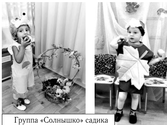
Группа «Солнышко» садика №31 порадовала костюмами.