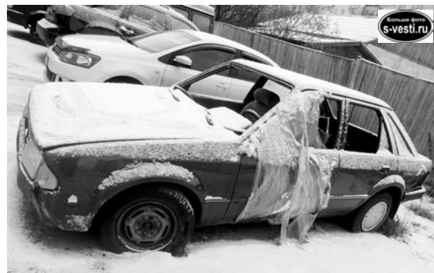
В районе домов №24-26 по ул. Сафонова парковочное место занимает авторухлядь.

Только в течение двух последних месяцев поступило около десятка жалоб от североморцев. В частности, жители сетуют на автохлам из четырех машин на ул. Сизова, 15, брошенные автомобили на ул. Инженерной, 2, ул. Сафонова, 24-26, ул. Гвардейской, 31-32, у военной части 90719. А у праздничной площадки в п. Сафоново осел «умерший» ЗиЛ. Этот автохлам не только мешает нормаль-