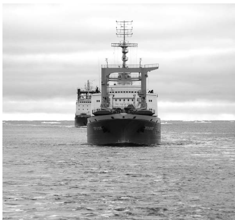
С мая и по октябрь суда обеспечения Северного флота доставляют необходимые для зимовки грузы в труднодоступные районы Арктики.

Затрудненный подход к берегу – отличительная черта Кольского полуострова и ряда арктических островов. На побережье Баренцева моря сосредоточено много объектов флота, у которых вместо причала – каменистый берег и скалы. В эти пункты доставляют относительно небольшие объемы сухих грузов (от 30 до 80 тонн), но выгрузить их непросто. Требуется использование маломорных судов, способных выйти к береговой линии как десантный корабль. Организацию передачи груза в этих пунктах можно считать ювелирной работой, кото-