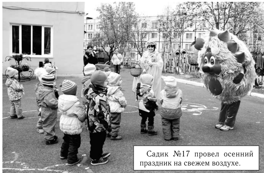
Садик №17 провел осенний праздник на свежем воздухе.

У кого-то персонажи больше сказочные, другие делают упор на русские народные традиции — каждый праздник по-своему яркое.