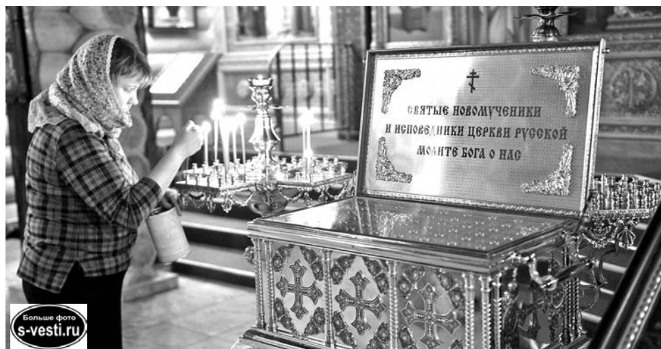
Считается, что у мощей российских новомучеников хорошо помолиться о даровании гражданского мира и согласия.