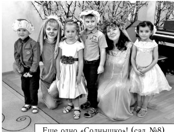
Еще одно «Солнышко!» (сад №8).