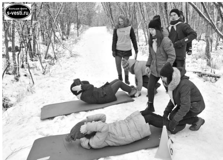
Команде необходимо было сделать по 70 подъемов туловища.

- Историю Родины, своего города, сражений, которые проходят на Кольской земле, мы знаем наизусть, поэтому вопросы квеста для нас были достаточно легкими, - поделилась участни-