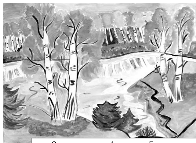
«Золотая осень», Александр Безручко.