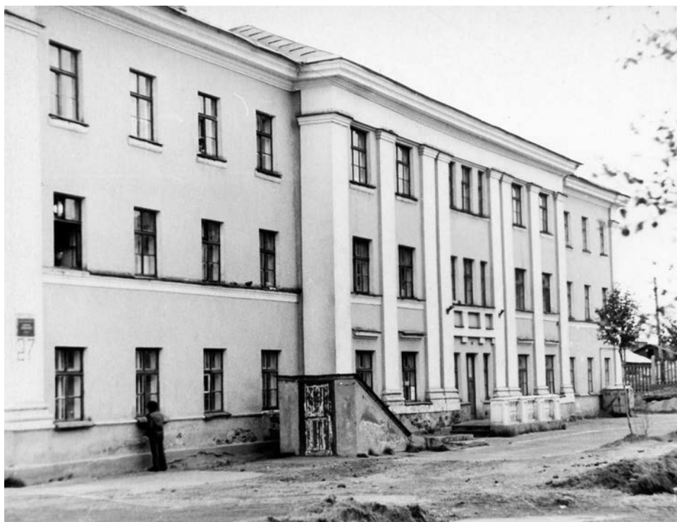
Первое здание североморской горбольницы, ныне - детское и неврологическое отделения ЦРБ.