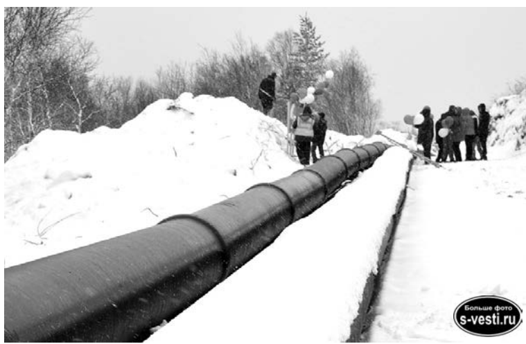
На сегодняшний день уже весь трубопровод находится на глубине залегания 1,5 метра.

пользуем другой материал - ориентированные полимеры.