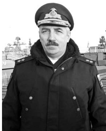
Вице-адмирал Олег Голубев.

- На Таймыре мы пробыли две недели. После выгрузки наши подразделения совершили марш в район проведения операции на плато Путорана. По легенде учения в районе Дудинки террористы заминировали берег и захватили важный промышленный объект. Объединенная группировка сил Северного флота при поддержке авиации и спецназа ЦВО обеспечила высадку десанта на необорудованное побережье для наступления вглубь полуострова Таймыр. Наши десантные корабли провели выгрузку более 50 единиц колесной и гусеничной техники морской