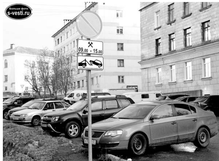
Есть много знаков у новаторов, но долго ль ждать эвакуаторов?