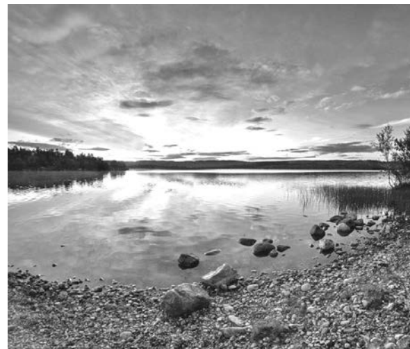
Озеро Нижнее Ваенгское.

Чтобы питьевую воду в озёрах и реках не загрязняли, вокруг мест водозабора созданы зоны санитарной охраны. Например, зона санитарной охраны озера Нижнее Ваенгское состоит из двух поясов. Первый пояс – 100 метров во всех направлениях от водозабора, второй – 5 километров также во все сто-