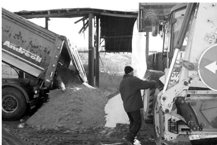
Приготовление пескосоляной смеси и ее загрузка в «посыпалку» - быстрый и слаженный процесс.

В.В.ЕВМЕНЬКОВ, глава ЗАТО г.Североморск.