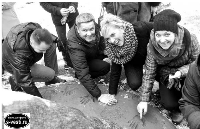
Отпечатки ладоней тех, кто приложил руки к созданию сквера, станут его украшением.