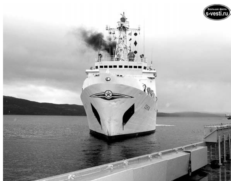
За время похода гидрографы выполнили около 10 тысяч километров маршрутного промера.