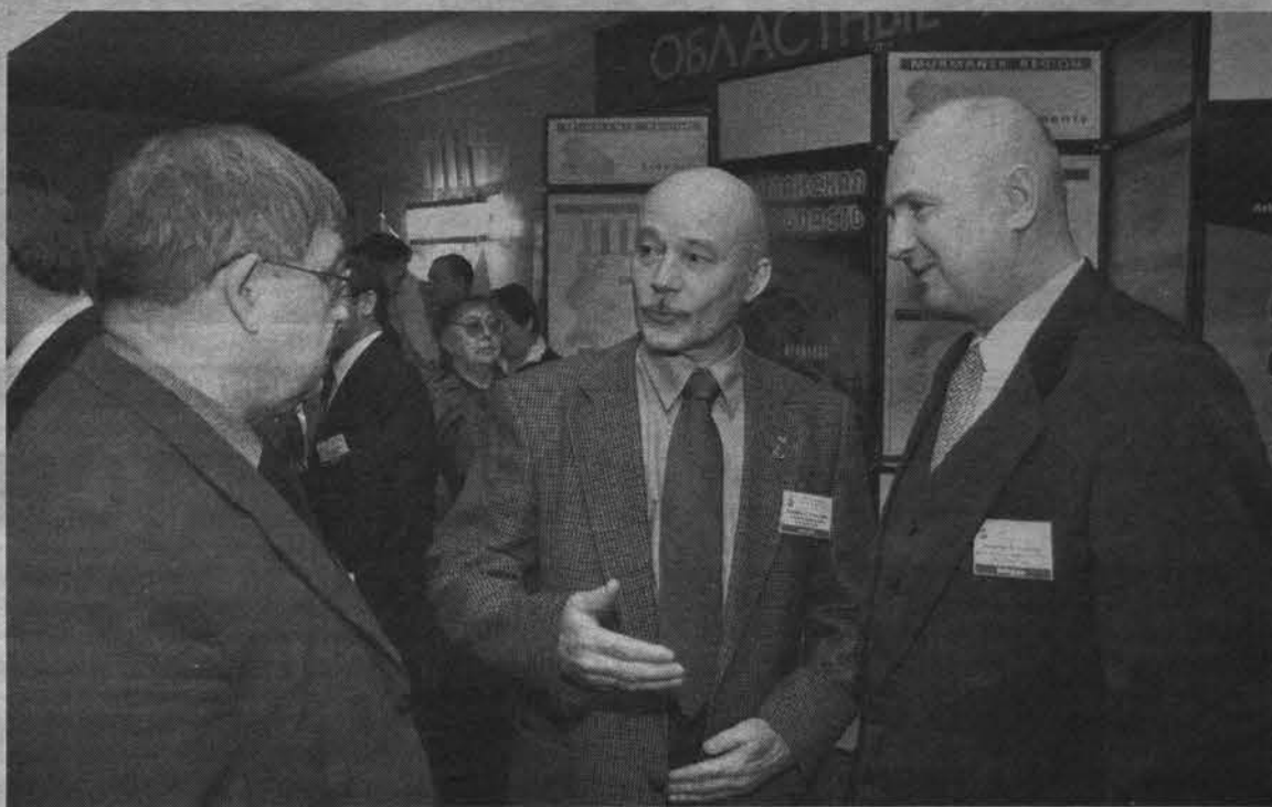
Жаркие дискуссии в кулуарах.