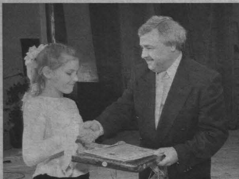
Заслуженная награда из рук мэра.