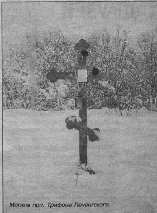
Могила прп. Трифона Печенгского.