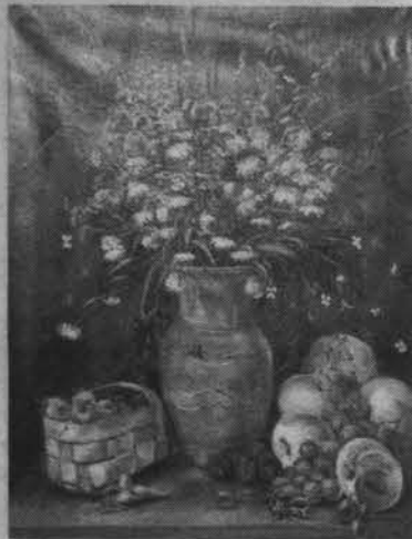
Натюрморт с персиками.

Некоторые из работ уже знакомы зрителям по экспозиции в читальном зале центральной библиотеки Североморска. В ретроспективной части есть постановочные натюрморты, выполненные в учебном порядке на занятиях во флотской изостудии под руководством