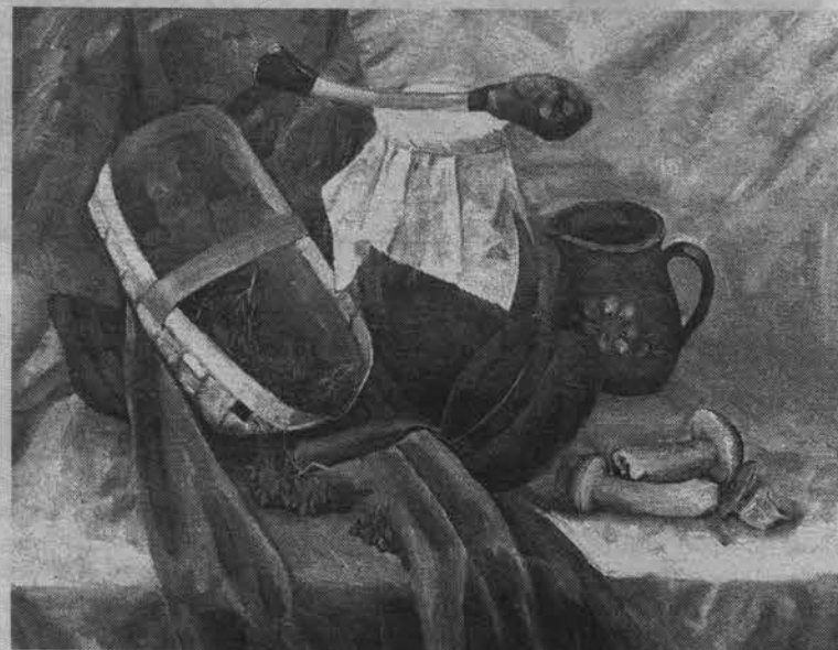
Натюрморт с кувшином.