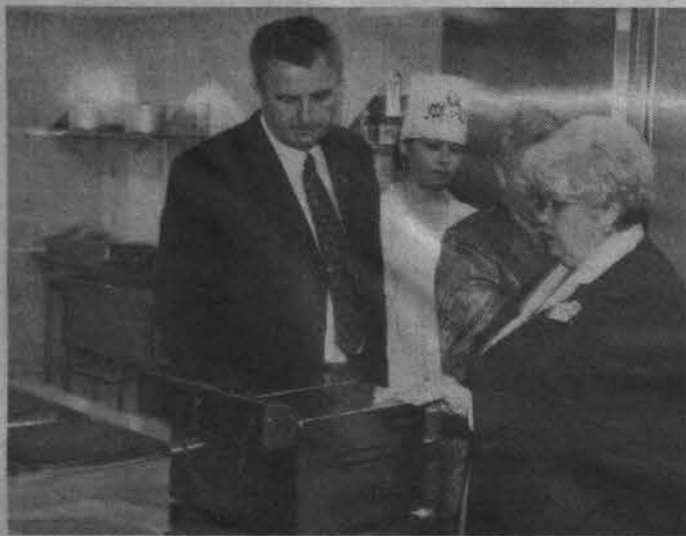
Кухня - сердце предприятия питания.