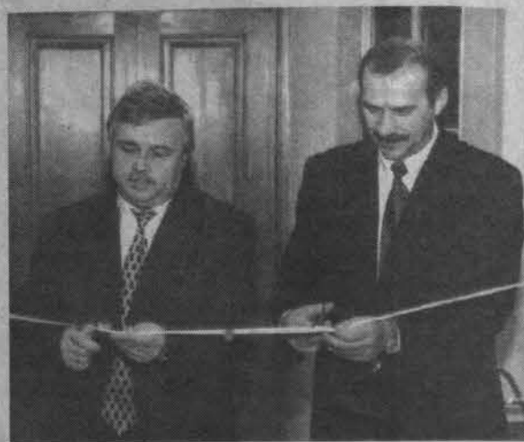
Кафе объявляется открытым...

Новинкой для нашего города оказалась и фирменная (по рассказам, той же фирмы, что и на яхте российского президента) кофеварка, с помощью которой любой желающий может отведать прекрасный итальянский кофе «Данези». А закупленная подobaющего качества оригинальная посуда только придаст процессу вкушения эстетический вид. Добавьте к этому красивый интерьер - плод десятилетнего ремонта, бар и «живую» музыку, новейшую сантехнику, вплоть до импортной посудомойки, чем-то напоминающей душ, раздельные машины, печь для кухон-