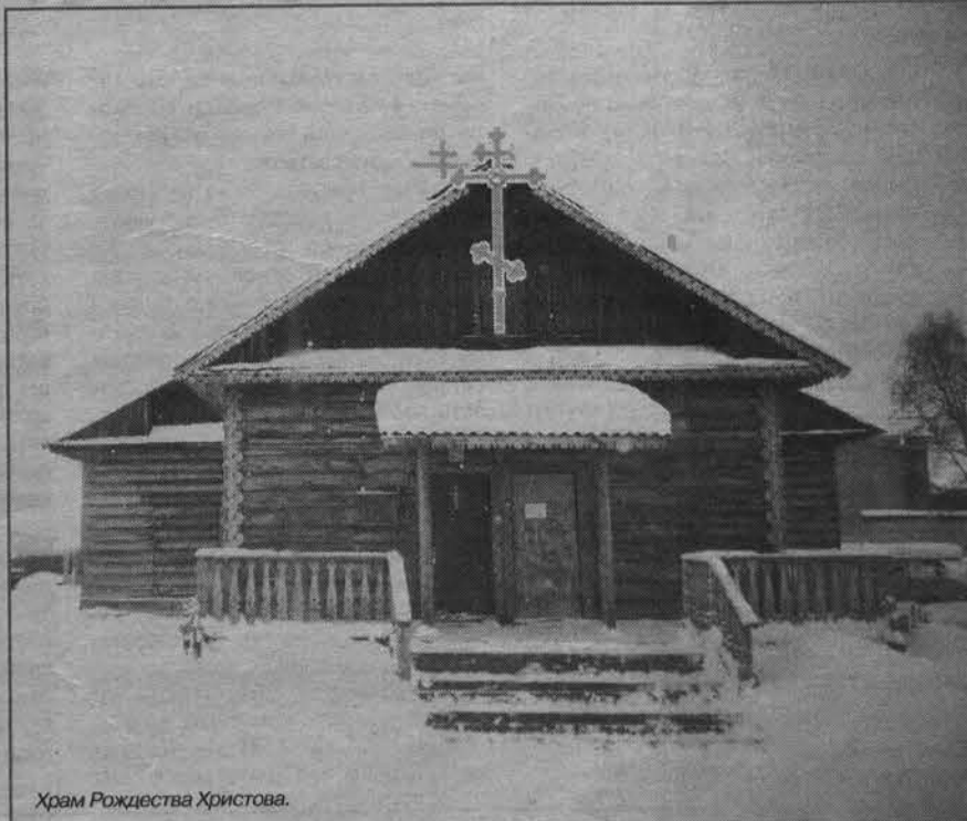
Храм Рождества Христова.

Тем временем шоссе среди обрывистых скал круто свернуло вниз - к мосту через реку Печенгу. На противоположном берегу показалась святая обитель - Трифонов Печенгский мужской монастырь.