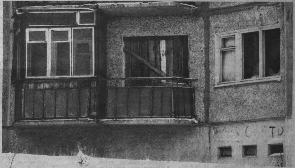
Бесхозное жилье скучает без хозяев.

Мне известны «крутые» задолжники приватизированной квартиры, чья жизнь протекает по примеру секретных агентов. На случай прихода представителей коммунальных служб ими разработана специальная система оповещения, так что непосвященный может целый день простоять на площадке, непрерывно нажимая на кнопку звонка (на себе это испытали и судебные приставы, приходившие описывать имущество). Для особо настойчивых