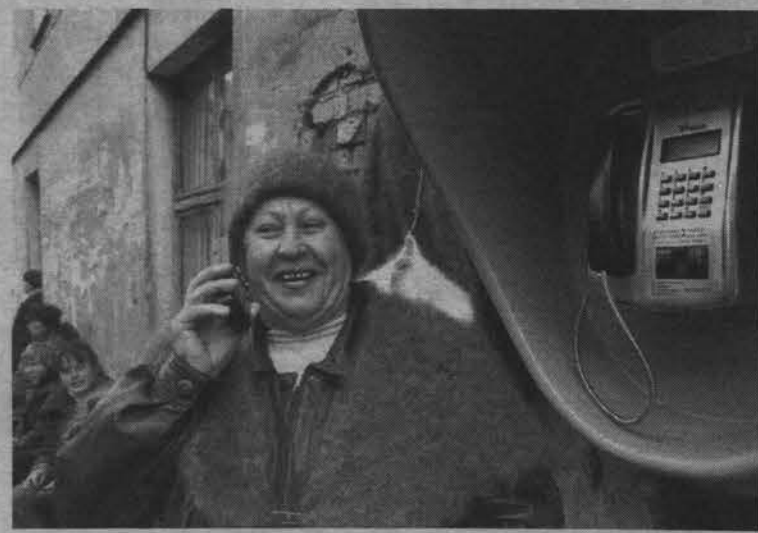
Хорошо тебе, милая, говорить «не кладите трубку», а деньги-то каплют.

Но, видно, так уж у нас повелось, что путь к европейскому стандарту должен непременно пролежать через нашу российскую бестолковщину и наплевательское отношение монополистов к своим клиентам (за счет которых они, кстати, живут). Теперь чтобы дозвониться до нужного вам человека, надо запастись не только большим терпением и временем, но и изрядным количеством справок, которые по телефону раздобыть столь же невозможно, как и сам заветный номер. На невинный запрос в справочную (которая находится почему-то в Мурманске) не сменился ли, допустим, номер 7-49-такой-то, вежливый механический голос автоответчика прочитает вам для начала инструкцию: если вам нужен номер предприятия, надо знать его точ-