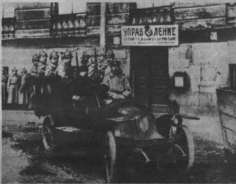
Чекисты перед выездом на задание.