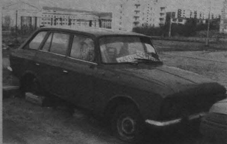
От осени до зимы - один шаг. Не холодно ли твоей «босоножке», хозяйин?