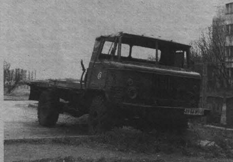
Стоянка грузового транспорта в жилой зоне вообще запрещена. А такого?