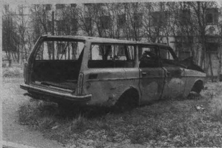
Когда-то это была «Вольво». Теперь в этой груде железа с удовольствием играют детишки. Им - радость, родителям - беспокойство.

Проблема в другом: 33 «брошенки» - с номерными знаками. Значит, они зарегистриро-