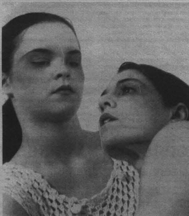
Сцена из спектакля «Будущее не кончается».

требовало соответствующих режиссерских действий. Как Вы работали над спектаклем? С какими проблемами столкнулись на репетициях?