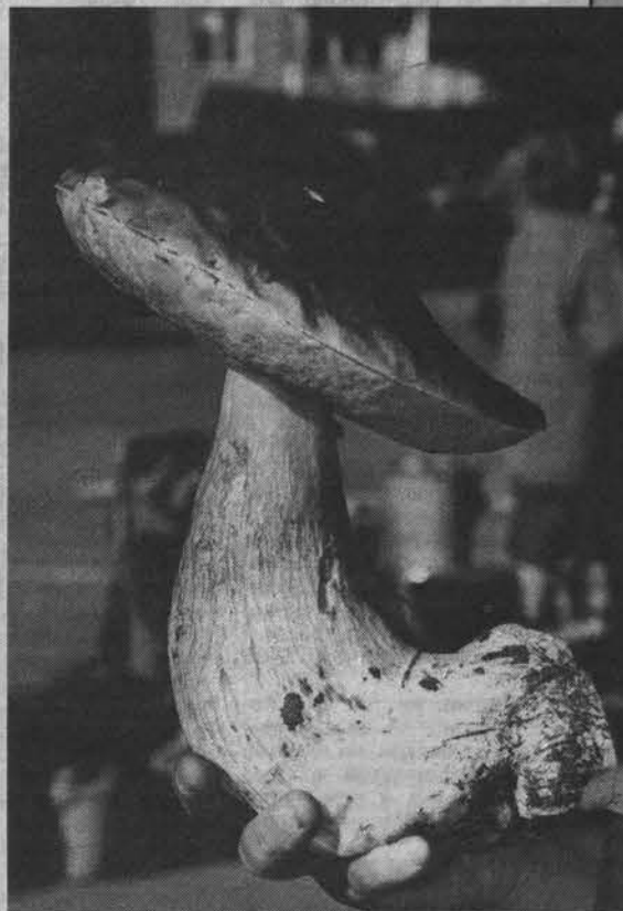
Чистые крепкие грибы такой величины у нас не редкость.

Марина ГРАБАРОВСКАЯ.