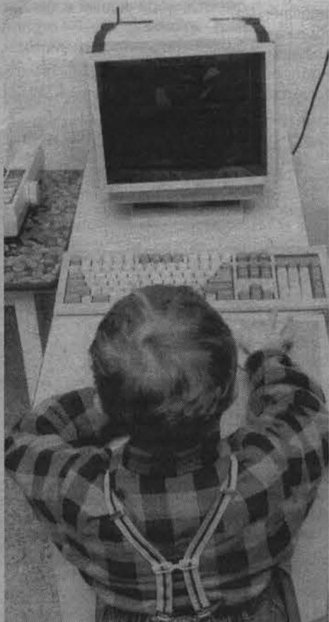
До начала нового учебного года