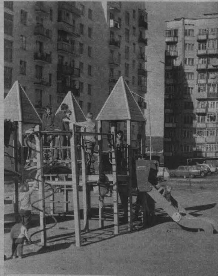
Новая детская площадка на ул. Морской понравилась ребятишкам.