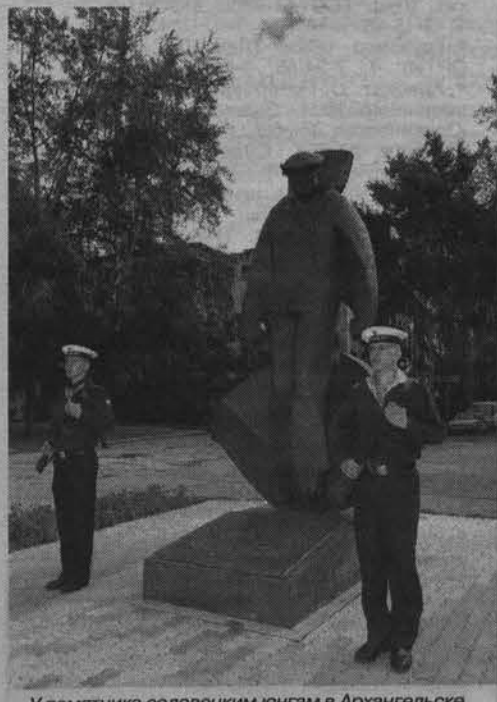
У памятника соловецким юнгам в Архангельске.