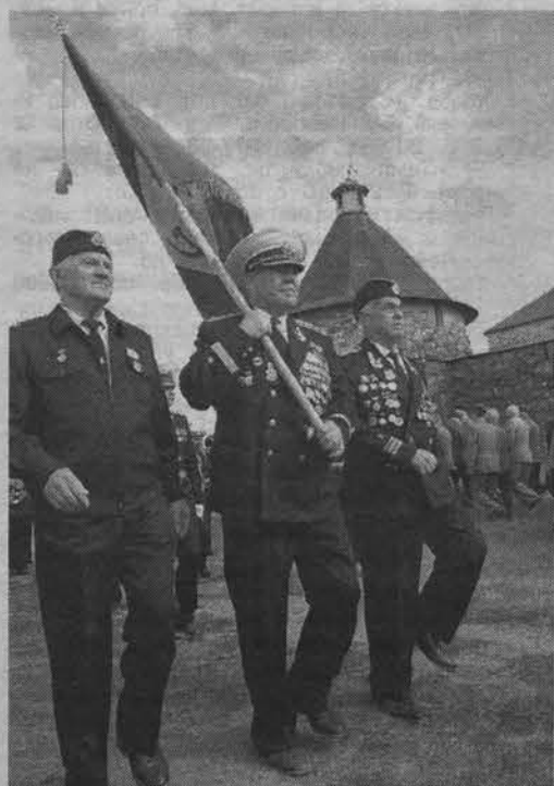
Снова в строю.

По-разному сложились судьбы соловецких юнг, и далеко не все связали свое будущее с морем. Но для каждого из них год обучения в легендарной школе - целая эпоха, старт во взрослую жизнь. Потому были понятны и слезы волнения, набегавшие на глаза участников нынешнего юбилейного слета при виде островов своей юности, и радость от долгожданной встречи с товарищами. Правда, совсем немного их осталось, мальчишек сороковых. На юбилейную встречу прибыло 127 ветеранов из России и стран ближнего зарубежья. Торжественные построения, митинги, посещения мест, где когда-то подростки военной поры постигали азы моряцкого ремесла, минуты скорби, задушевные беседы - вот чем жили с 4 по 7 августа соловецкие юнгаши.