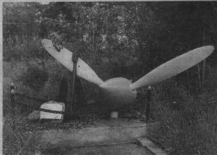
Памятник погибшим работникам рембазы.