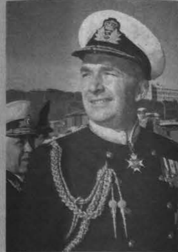
Командующий флотом Великобритании адмирал сэр Алан Уэст.

Торжественный парад, необыкновенное представление на воде, праздничный выход свиты Нептуна, экскурсии на военные корабли родного флота, игры и развлечения для детей, изобилие торговой ярмарки, концерт местных артистов, музыкантов, исполнителей и столичной звезды - ансамбля «Любэ», красочный фейерверк - все это останется в памяти жителей и гостей Североморска. А в этом году на флот приехало более пятидесяти шефских делегаций из разных городов России.