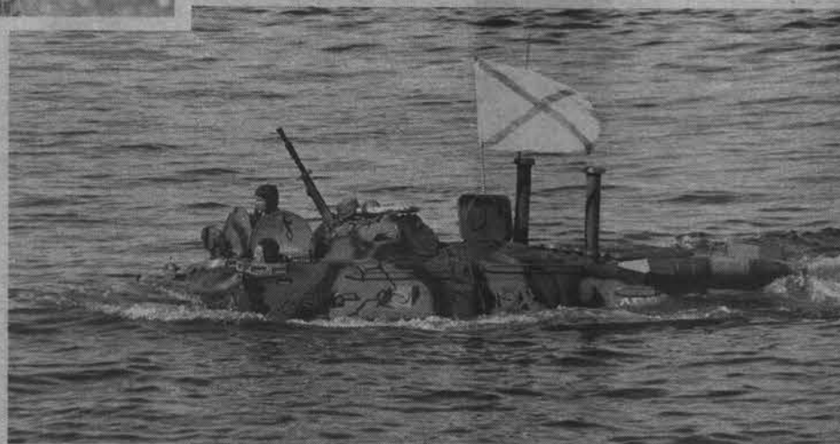
С моря - в бой.