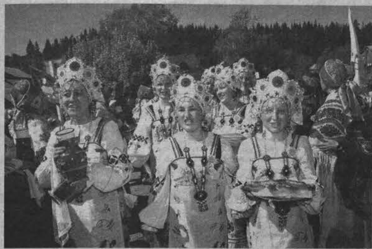
Образцово-художественный ансамбль народной песни «Родничок».

Этот песенный народный праздник неизменно приходит на Кольский полуостров в светлом июне, во время белых ночей. В минувшие выходные старинное поморское село Умба на два дня превратилось в центр культурной жизни области - здесь проходил третий международный фольклорный фестиваль Баренцева региона и Северо-Запада России. Он собрал коллективы из Мурманской, Архангельской, Ленинградской областей, Белоруссии,