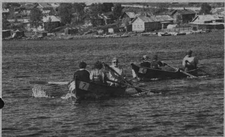
Представительницы прекрасного пола отважились на участие в гребной регате.

По горизонтали: 5. Класс важнейших породообразующих минералов. 6. Персонаж произведения «Граф Монте-Кристо» (Дюма). 9. Станция Московского метрополитена. 12. Быстроходная узкая легкая гребная шлюпка. 13. Город во Франции. 14. Разновидность тележки. 17. Участник соревнований в одной из возрастных групп. 18. Русский полярный исследователь. 19. Город в США. 20. В спорт. поединках период боя между двумя перерывами. 25. Тяжелый атлет, 1-й советский чемпион мира. 26. Огородное, лекарственное растение. 27. Город в Японии на о-ве Хоккайдо. 30. Русский художник, автор картины «Ярмарка». 31. Высочайшая горная вершина Альп. 32. Садовый цветок.