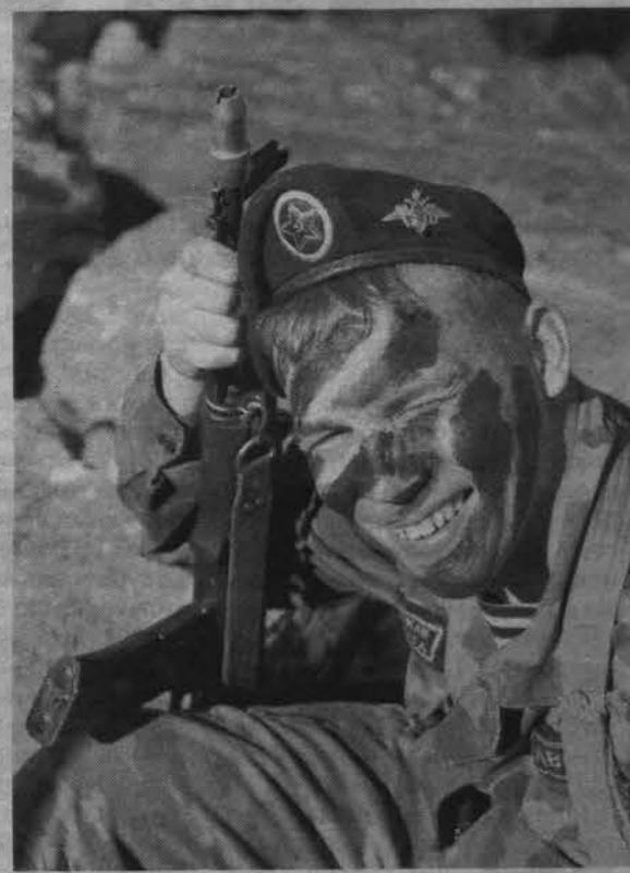
Служба в морской пехоте - для настоящих мужчин.