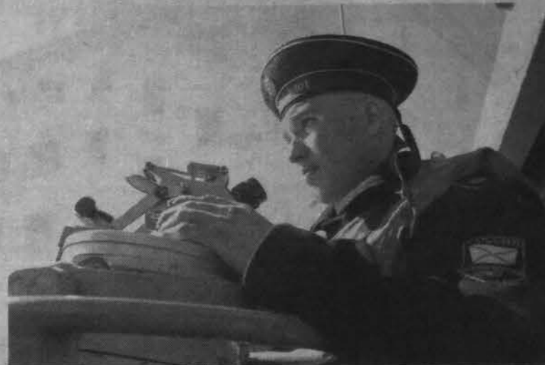
Вышел в море - бди в оба.

На знакомство с соединениями Северного флота слушателям академии отведена неделя. Они уже выходили в море на БПК «Адмирал Чабаненко» и СКР «Задорном», где моряки-североморцы