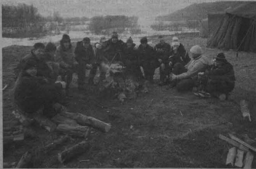
Греется чай - греемся сами.

Выехав из Североморска, колонна велосипедистов благополучно доехала до Колы, но когда они повернули на северо-запад, ветер стал встречным, согласно сводке гидрометцентра, в порывах - 20 метров в секунду. Все это создавало своеобразный барьер, преодолеть который не удалось. После 10 км борьбы со снежными зарядами велосипедистам пришлось пересесть в автобус. В Долине Славы их ждали мор-