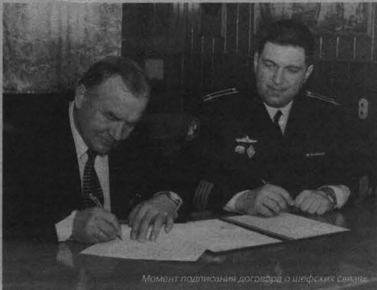
Момент подписания договора о шефских связях.