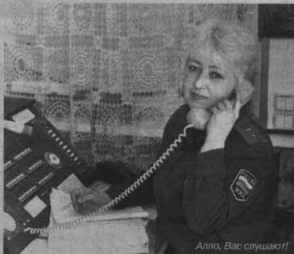
Алло, Вас слушают!

Жизнь не стоит на месте, поэтому сегодня облачение пожарного (термоотражающий костюм) больше отдаленно смахивает на космический скафандр. Новые противогазы (кстати, весом 17 килограммов) позволяют дышать нормально даже в самом задымленном помещении. Однако обеспечение безопасности людей при пожаре до сих пор остается серьезной проблемой. Сложность ее с годами возросла. Связано это со значительными изменениями в планировке зданий, обросших многослойными панелями с полимерным утеплителем, применением горючих теплоизоляционных, акустических и отделочных материалов (короче, всего того, что хорошо горит), массовым пребыванием людей в помещениях