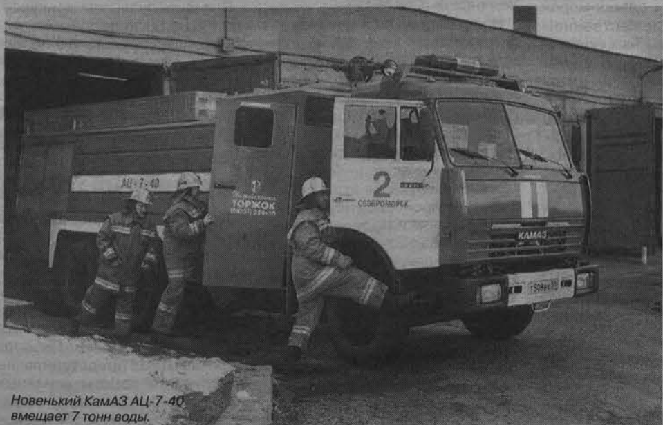
Новенький КамАЗ АЦ-7-40 вмещает 7 тонн воды.

(на предприятиях, в учреждениях). Все это увеличивает угрозу быстрого распространения огня и дыма и приводит к гибели людей.