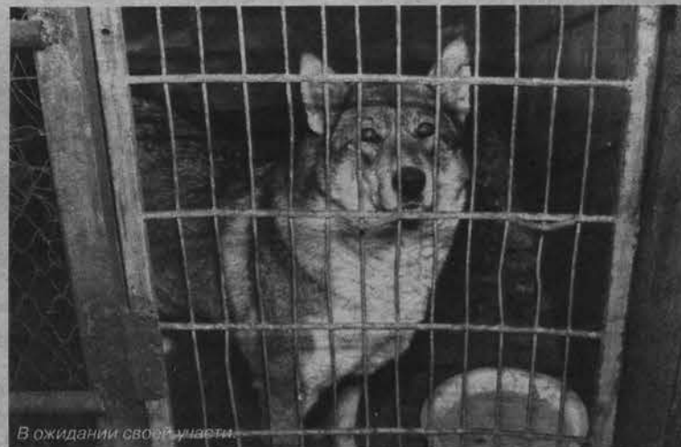
В ожидании своей участи.

Страшно видеть во дворе умирную дворнягу, разодранную своими же собратьями. Страшно подумать, что вот в такой же ситуации мог оказаться ребенок. И факты - упрямая вещь: с приходом весны число укушенных собаками людей увеличивается. Только за последний месяц за помощью обратились более 10 человек. И действия