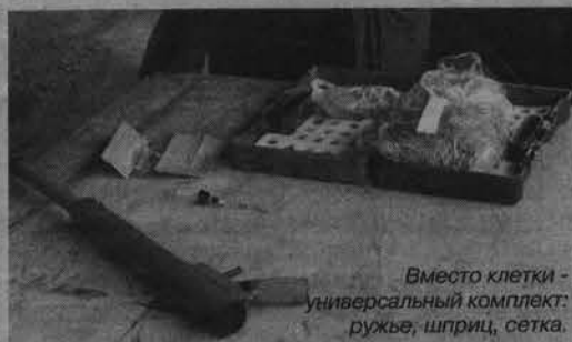
Вместо клетки - универсальный комплект: ружье, шприц, сетка.

сказал, что он уже приобрел, с какими трудностями столкнулся. Отказаться от клеток-капканов предлагается с помощью летающих шприцев, начиненных снотворным. Они выстреливаются из специального пневморужья. Можно также зарядить их ядом, но он продается только в концентрированном виде, и чтобы его развести, необходимо иметь собственную лабораторию. А кроме того, потребуется изменить способ утилизации, ведь начиненный смертельным препаратом труп животного уже не закопаешь в землю. Эти захоронения, бывает, вскрывают люди без определенного места жительства. Поэтому в идеале было бы неплохо приобрести печь. И, конечно, все это имеет свою, далеко не маленькую цену. Насколько она покажется реальной для городского бюджета, и будут подсчитывать на своих постоянных комиссиях депутаты.