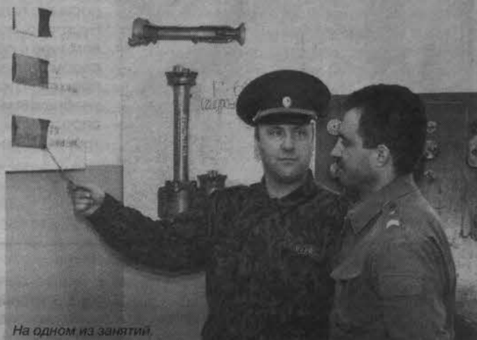
На одном из занятий.

А в свободное от выездов время - тренировки, отработки нормативов, специальные занятия. И еще - приятная подготовка к юбилею. Ведь 15 мая ПЧ-2 исполняется пять лет.