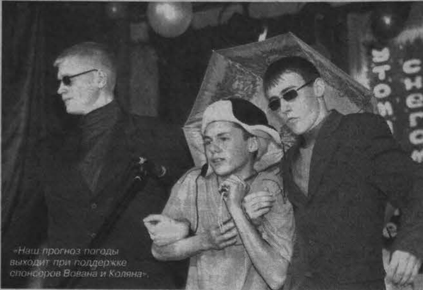
«Наш прогноз погоды выходит при поддержке спонсоров Вована и Коляна».

та КВН», и все без исключения участники боролись, включив мозги и душу. Запомнились шулки гимназистов: копчик - это маленький американский полицейский, среди деликатесов японского ресторана - недорогие блюда из фигги. Органично и опять же находчиво «Утомленные снегом» смогли вытащить, казалось, провальную ситуацию, когда бесконечно долго им готовили нужную фонограмму. Ребята не растерялись, сыграли без музыки, и этот экспромт тоже пошел им в зачет. «Экстремалы» хорошо придумали выход прогноза погоды при поддержке спонсоров - некто с тонким под рукою с нехилыми братками. Пробрали старину Газманова, «надругавшись» над его бессмертными текстами. «Эскадрон моих мыслей...» можно, оказывается, переписать к любому празднику: к Дню танкиста - «Эскадрон моих танков шальных», к 8 Марта - «Эскадрон моих женщин шальных», а к 1 Мая -