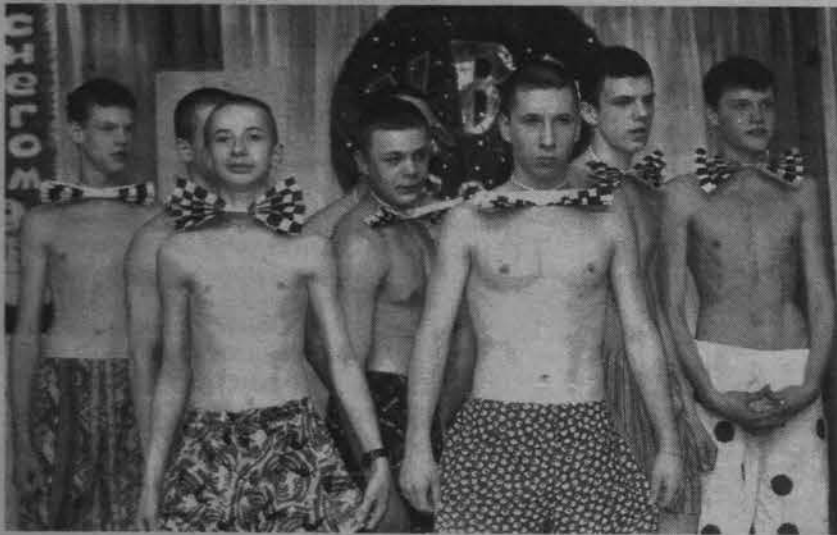
Хор мальчиков «СВ» блеснул нижним бельем.